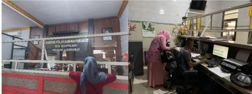
Gambar 2. Ruang Pelayanan Pemerintahan Desa Ngampelsari

Dari hasil wawancara diatas terlihat bahwa ruang pelayanan di Pemerintahan Desa Ngampelsari bersih dan nyaman, dan masyarakat Desa Ngampelsari yang sedang melakukan pelayanan merasa nyaman dengan kondisi ruang pelayanan.