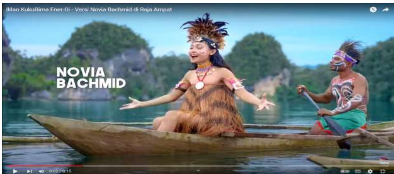
Gambar 4. Baju Kurung

Teluk Kabui sendiri merupakan sebuah tempat yang terkenal dengan keindahan alamnya, namun tidak banyak mitos atau legenda yang secara spesifik terkait dengan tempat ini. Meskipun demikian, dalam budaya setempat atau mitologi lokal, mungkin ada cerita-cerita yang beredar yang mengaitkan dengan keajaiban alam dan keunikan dari Teluk Kabui. Mungkin ada kisah-kisah lokal yang menceritakan tentang makhluk-makhluk gaib atau legenda sejarah tentang asal usul nama Kabui atau fenomena alam yang unik di teluk tersebut. Beberapa mitos mungkin juga berkaitan dengan kekuatan magis atau spiritual dari teluk tersebut, yang bisa termasuk kisah-kisah tentang perlindungan dari roh-roh atau kisah-kisah mistis lainnya yang terkait dengan kehidupan sehari-hari masyarakat setempat. Mitos-mitos ini tidak hanya menjadi bagian dari warisan budaya suatu daerah, tetapi juga berfungsi sebagai sarana untuk mengajarkan nilai-nilai budaya, menjaga lingkungan, atau menegaskan pentingnya melestarikan keindahan alam dan keajaiban alam di sekitar kita.