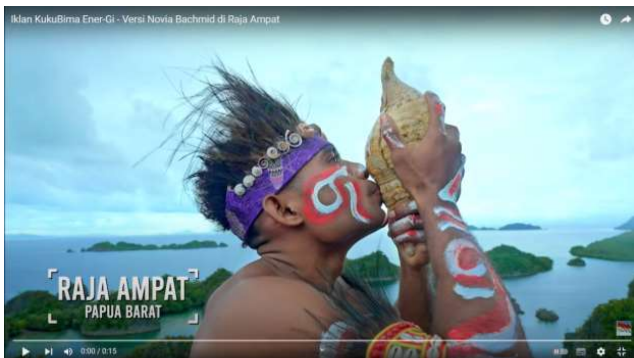
Gambar 1. Raja Ampat

KukuBimal Ener-Gi! C1000l adalah satu-satunya minuman energi dengan kandungan Vitamin C 1000l mg, I Ginseng, royal Ijelly, dan Vitamin B kompleksl yang baikl untuk menambahl stamina danl memelihara jagal daya tubuhl sehingga tubuhl menjadi lsehat.