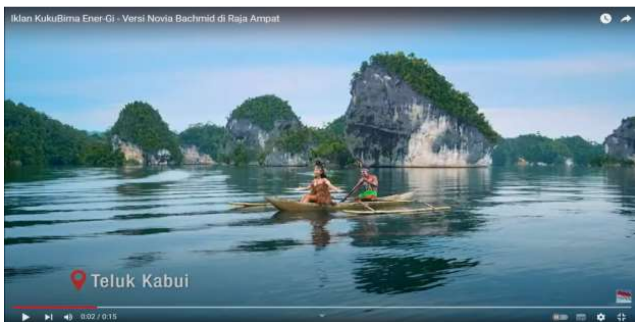
Gambar 3, Teluk Kabui

Telaga Bintang tidak memiliki cerita atau legenda spesifik yang dapat dihubungkan secara universal. Namun, dalam berbagai budaya dan tradisi, istilah "Telaga Bintang" dapat mengacu pada cerita atau legenda yang beragam tergantung pada latar belakang budaya atau sejarah masyarakat tertentu. Secara umum, mitos atau legenda yang terkait dengan Telaga Bintang mungkin berfokus pada aspek-aspek mistis atau spiritual, terutama yang terkait dengan keajaiban alam atau keberadaan makhluk gaib di sekitar telaga tersebut. Cerita-cerita semacam itu sering kali digunakan untuk menyampaikan pesan moral atau mengajarkan nilai-nilai penting kepada generasi masyarakat setempat. Di banyak kisah, Telaga Bintang dapat menjadi tempat suci di mana dewa atau makhluk mitologis tinggal, atau mungkin dianggap sebagai tempat suci untuk melakukan ritual atau upacara tertentu. Mitos Telaga Bintang mungkin juga berkaitan dengan kehidupan sehari-hari masyarakat setempat, yang mungkin percaya bahwa air dari telaga tersebut memiliki kekuatan penyembuhan atau kekuatan magis lainnya. Namun, penting untuk diingat bahwa cerita-cerita mitos Telaga Bintang dapat berbeda-beda tergantung pada konteks budaya dan sejarah masyarakat yang menceritakannya. Cerita-cerita ini sering kali menjadi bagian integral dari warisan budaya suatu daerah, yang menandai pentingnya alam dan keajaiban yang ada di sekitar kita.