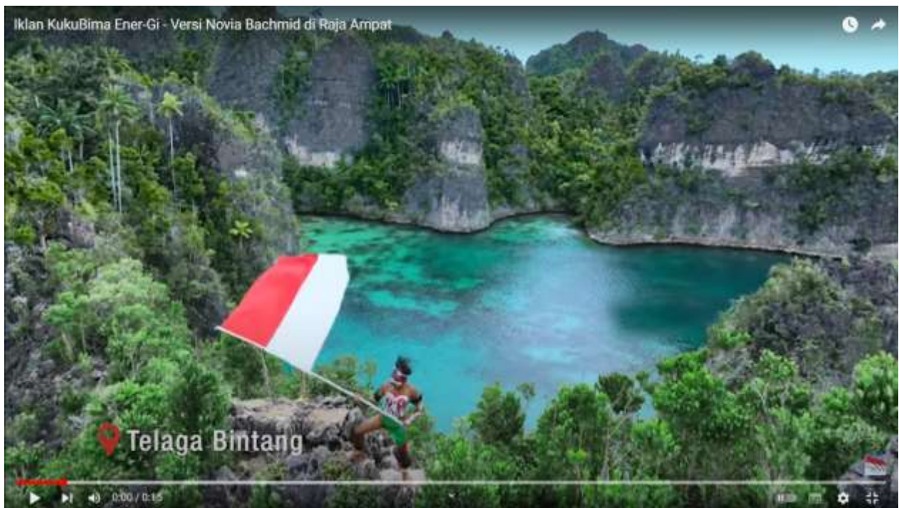
Gambar 2. Telaga Bintang

Raja Ampat, selain terkenal dengan keindahan alamnya, juga memiliki beragam mitos dan legenda yang menjadi bagian dari budaya dan sejarah lokal. Salah satu mitos yang terkenal adalah tentang asal usul nama "Raja Ampat" sendiri, yang berasal dari cerita rakyat setempat. Cerita tersebut menceritakan tentang empat putra raja yang mendiami daerah itu. Mereka diyakini sebagai pelindung alam dan sumber kekayaan alam Raja Ampat. Selain itu, ada juga mitos dan legenda seputar kekayaan alam yang ada di Raja Ampat, seperti tentang keberadaan harta karun yang tersembunyi di dalam gua atau terumbu karang. Beberapa mitos lokal mungkin juga berkaitan dengan makhluk-makhluk mitologis atau cerita-cerita tentang nenek moyang dan asal usul suku-suku yang mendiami daerah tersebut. Mitos dan legenda sering kali menjadi bagian integral dari budaya suatu tempat, menyampaikan nilai-nilai dan keyakinan masyarakat setempat. Mereka tidak hanya menghibur, tetapi juga menceritakan asal usul dan identitas suatu tempat, serta mencerminkan cara pandang dan hubungan manusia dengan alam sekitarnya. Mitos Raja Ampat menggarisbawahi pentingnya hubungan manusia dengan alam serta kekayaan alam yang harus dijaga dan dihormati.