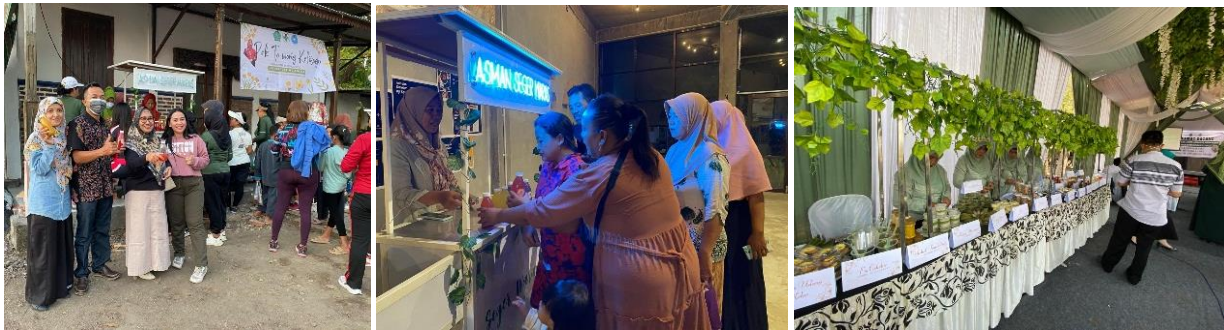
Gambar 6 Penjualan Produk Olahan

“Iya pak agar usaha olahan makanan dan minuman berkembang PKK mengarahkan warga Tambak Kalisogo yang sudah mau ikut dalam menjalankan usaha olahan makanan dan minuman itu awalnya warga diajarkan mengenai langkah-langkah yang dilakukan dalam proses pembuatan olahan tersebut untuk dilakukan dengan hati-hati dalam menjaga kualitas yang baik dan cara agar olahan tersebut dapat bertahan beberapa hari. Semua olahan yang kami buat dari hasil kami menanam sendiri.” (Wawancara, 26 Februari 2024)