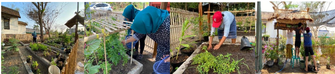
Gambar 5 Perawatan Taman ASMAN

“Kegiatan PKK disini juga selain membuat olahan makanan dan minuman, kami juga ada kegiatan perawatan taman ASMAN yang kami lakukan dua kali per minggu”. (Wawancara, 26 Februari 2024)