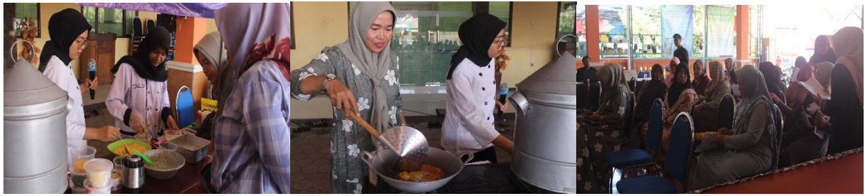
Gambar 4 Pelatihan Pengolahan Ikan

Pernyataan yang sama juga disampaikan oleh ketua PKK Desa Tambak Kalisogo sebagai berikut: