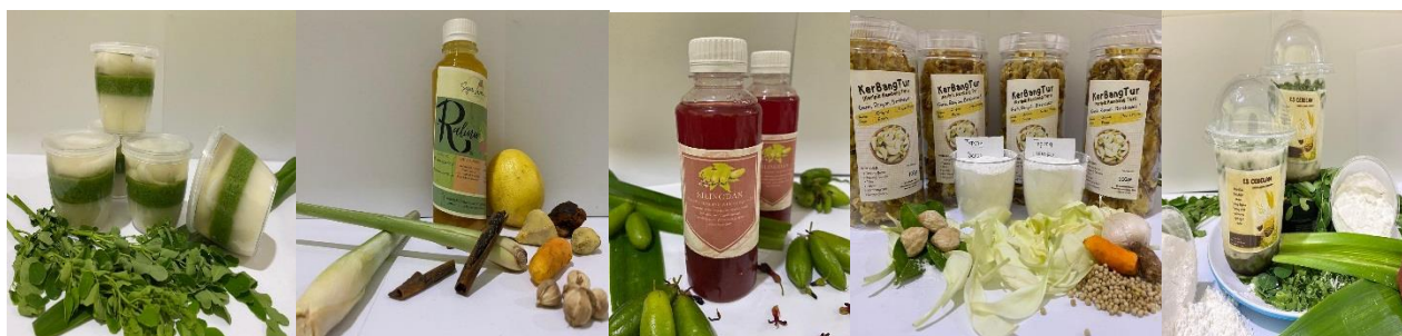
Gambar 3 Olahan makanan dan minuman

“Selain kegiatan tersebut PKK Desa Tambak Kalisogo juga mengikuti berbagai pelatihan yang diadakan oleh Dinas setempat untuk mengembangkan potensi dan kemampuan anggota PKK agar terus berkembang dan maju”. (Wawancara, 26 Februari 2024)