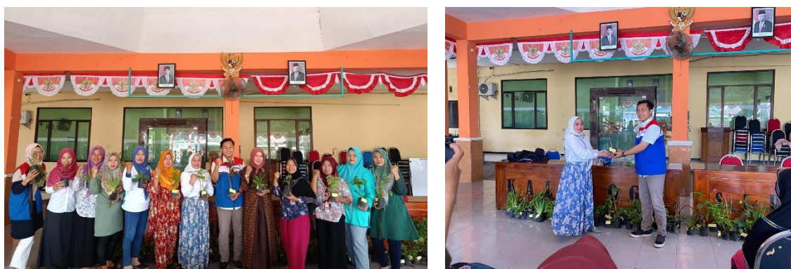
Gambar 1 Serah Terima Bantuan CSR PGN

Berikut disampaikan dokumentasi kegiatan CSR PGN dengan anggota PKK Desa Tambak Kalisogo berupa bibit tanaman toga yang diharapkan menambah macam koleksi tanaman toga milik asman Desa Tambak Kalisogo agar mampu membuat olahan asman yang lebih bervariasi.