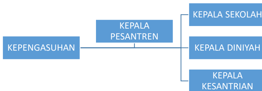
Struktur organisasi pesantren eKISI

Menurut siregar kunci utama pengorganisasian agar berjalan baik adalah dengan pembagian kerja untuk terbentuknya organisasi yang terus saling bersinergi. Dapat dilihat melalui beban kerja individu dan kelompok, hubungan antar personal, wewenang yang diemban serta pemanfaatan fasilitas yang dimiliki instansi. Kualifikasi personal yang rendah diberikan beban kerja yang mudah dan begitu sebaliknya, hingga tupoksi kualifikasi dan beban kerja dapat bersanding baik dan tidak membuat kebosanan, keletihan serta hilangnya motivasi bekerja dapat dihindari [33].