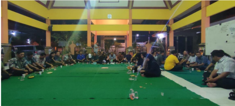
Gambar 2. Kegiatan Sosialisasi Aplikasi SIKS-NG Desa Banjarbendo

Pada indikator integrasi dapat ditarik sebuah pemahaman bahwa dalam prosedur dirasa belum efektif karena minimnya pemantauan terhadap Operator SIKS-NG dalam melakukan program pemuktakhiran data di Desa Banjarbendo oleh Dinas Terkait. Sedangkan sosialisasi pada stakeholder yang ada di Desa Banjarbendo dapat dikatakan kurang, hal tersebut dikarenakan hanya dilakukan satu kali kegiatan sosialisasi ketika awal penggunaan aplikasi SIKS-NG tersebut. Hal tersebut dikarenakan pihak Desa Banjarbendo menganggap pembalasan tersebut tidak berkaitan langsung dengan masyarakat miskin melainkan dengan operator yang mengoperasikan aplikasi SIKS-NG dilingkungan Desa Banjarbendo Kecamatan Sidoarjo Kabupaten Sidoarjo. Hal tersebut jika dikaitkan dengan penelitian terdahulu yang berjudul “Efektivitas Aplikasi Program Pendataan Kesejahteraan Sosial Next Generation Berbasis Aplikasi SIKS-NG Di Dinas Sosial Kabupaten Gowa” pada indikator sosialisasi program dijumpai hal yang berbeda dengan penelitian saat ini yaitu di Kabupaten Goa telah melakukan sosialisasi dengan baik salah satunya dengan cara melakukan sosialisasi program beberapa media yang digunakan untuk menyebarkan informasi kepada masyarakat adalah dengan menggunakan poster, pamflet, dan spanduk yang dipasang di tempat-tempat strategis.