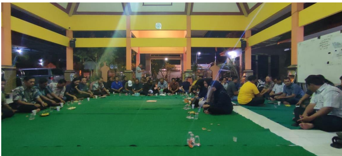
Gambar 3. Kegiatan Sosialisasi Aplikasi SIKS-NG Desa Banjarbendo

Meskipun pembaharuan pada aplikasi SIKS-NG terus menerus dilakukan, namun sosialisasi pada stakeholder yang ada di Desa Banjarbendo hanya dilakukan kurang dilakukan, hal tersebut dikarenakan hanya dilakukan satu kali kegiatan sosialisasi ketika awal penggunaan aplikasi SIKS-NG tersebut. Hal tersebut dikarenakan pihak Desa Banjarbendo menganggap pembaharuan tersebut tidak berkaitan langsung dengan masyarakat miskin melainkan dengan operator yang mengoperasikan aplikasi SIKS-NG dilingkungan Desa Banjarbendo Kecamatan Sidoarjo Kabupaten Sidoarjo. Berikut merupakan foto kegiatan sosialisasi Aplikasi SIKS-NG Desa Banjarbendo Kecamatan Sidoarjo Kabupaten Sidoarjo sebagai berikut: