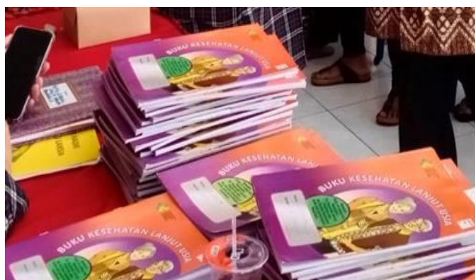
Gambar 1 Kartu Menuju Sehat (KMS) Lansia

Tabel di atas merupakan data terkait sosialisasi dan juga pendampingan yang telah dilakukan oleh kader posyandu lansia Arum Dalu dari tahun 2022 hingga saat ini yang terlaksana pada tahun 2024. Dalam upaya meningkatkan kesadaran kesehatan masyarakat desa Gelam terutama masyarakat Lansia tentang pentingnya aktivitas fisik bagi lansia dan juga pencegahan penyakit-penyakit kronis bagi lansia, Desa Gelam bekerjasama dengan Kader Posyandu, Kader PKK, dan juga tim kesehatan dari Puskesmas telah melaksanakan serangkaian sosialisasi dan pendampingan secara berkala. Setiap 6 bulan sekali dalam setahun. Selain itu, kader posyandu Arum Dalu melakukan pemantauan kesehatan lansia dengan membagikan Kartu Menuju Sehat (KMS) Lansia seperti gambar dibawah ini