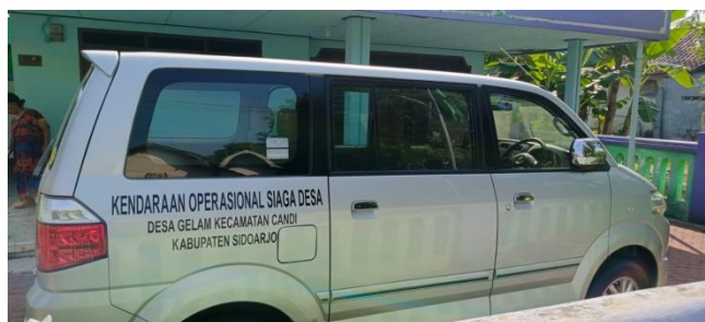
Gambar 3 Kendaraan Operasional Siaga Desa

Gambar 2 merupakan salah satu contoh undangan yang telah disebarluaskan kepada ketua RT/RW di desa Gelam yang ditujukan untuk para warga Lansia agar dapat mengikuti kegiatan rutin demi menjaga kesehatan para warga.