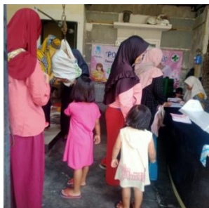
Gambar 7. Kegiatan Posyandu di setiap Pos di Desa Kalipecabean

merangkap tugas, membantu kader yang baru Pengetahuan kader lama dan kader yang baru jelaslah berbeda, kader yang lama lebih memiliki pengalamannya dari pelatihan-pelatihan dan praktek. Adapun dokumentasi yang dapat diambil dalam kegiatan tersebut seperti bawah ini: