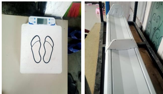
Gambar 5. Alat penimbangan dan ukur tinggi badan

diperlukan dukungan yang besar baik dari segi pengadaan alat dan dukungan lainnya. Para kader berusaha sebaik mungkin untuk tetap melaksanakan kegiatan posyandu, sehingga rela mengeluarkan uang pribadi untuk membeli alat atau meminjam alat kepada puskesmas. Berikut kami lampirkan juga contoh alat timbang berat badan dan alat ukur tinggi badan yang ada diposyandu Teratai Desa Kalipecabean