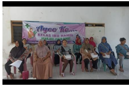
Gambar 4. Kelas Bumil Posyandu Teratai Desa Kalipecabean

Selain itu untuk mendukung upaya penurunan stunting salah satunya dengan cara mempersiapkan kehamilan yang sehat sehingga diharapkan dapat melahirkan bayi yang sehat pula. Berikut kami lampirkan dokumentasi kegiatan senam ibu hamil di Posyandu Teratai Desa Kalipecabean.