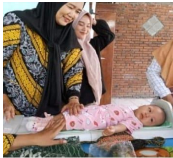
Gambar 3. Kegiatan penimbangan dan ukur tinggi badan