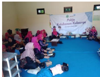
Gambar 6. Pelatihan Kader Kesehatan Posyandu Teratai Desa Kalipecabean

Maka dari itu kader kesehatan perlu dibekali pelatihan-pelatihan yang memadai, pelatihan ini ditujukan untuk menambha wawasan dan meningkatkan kemampuan IT para kader guna mendukung tugas penginputan yang diberikan. Peningkatan kemampuan dan ketrampilan kader dapat menjadi bekal dalam melaksanakan program dari pemerintah. Pelatihan peningkatan ketrampilan harus ditingkatkan dan dilakukan secara berkala seperti pada gambar 1.4 dibawah ini: