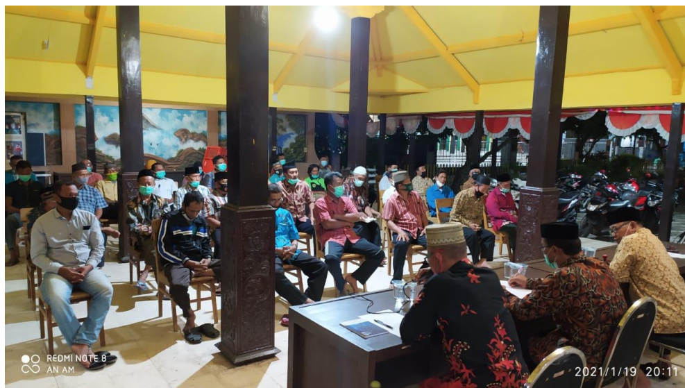
Gambar 1. Dokumentasi Kegiatan Sosialisasi Aplikasi SIKS-NG

Berdasarkan wawancara diatas dapat diketahui bahwa ada kegiatan sosialisasi yang dilakukan oleh Dinas Sosial Kabupaten Sidoarjo yang diberikan kepada perangkat Desa Se Kabupaten Sidoarjo. Salah satu Desa yang mengikuti kegiatan tersebut adalah Desa Kupang. Berikut meurpakan dokumentasi kegiatan sosialisasi yang dilakukan sebagai berikut: