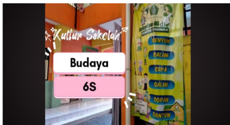
Gambar 3.1 Budaya 6S

Budaya tersebut juga mendukung capaian kalimat thoyibah, dari pernyataan kepala sekolah di atas dapat disimpulkan bahwa dengan membiasakan diri melakukan hal-hal yang positif maka akan terbentuk akhlaq yang positif pula. sekolah dan guru tidak dapat memberikan kewenangan penuh terhadap perubahan yang dialami siswanya, namun guru hanya bisa melakukan sebatas mendampingi saja. Perubahan pada anak akan terlaksana pada kesadaran dari diri siswa tersebut.