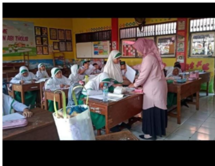
Gambar 2.2 ( Anak aktif bertanya )

Kurikulum Merdeka belajar yang merupakan salah satu inovasi dalam sistem pendidikan di Indonesia yang bertujuan untuk memberikan keleluasaan sekolah dalam mendesain kurikulum sekolah sesuai dengan kebutuhan peserta didik.