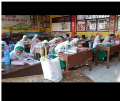
Gambar 2.1 ( Anak kondusif dengan metode dikte )