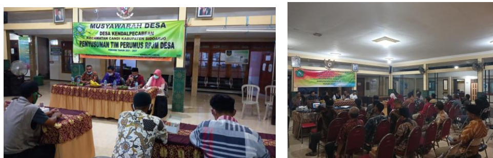
Gambar 3. Penjaringan usulan dan aspirasi warga dalam hal pembangunan (Sumber: Desa Kendalpecabean)

Dengan demikian bukan hanya dengan menyalurkan aspirasinya saja tetapi pengawasan pembangunan desa selalu diupayakan oleh Badan Permusyawaratan Desa Kendalpecabean dengan melibatkan tokoh masyarakat dan masyarakat sekitar dengan harapan pembangunan dapat berjalan sesuai dan transparan. Pengawasan pembangunan desa dilaksanakan dengan terlebih dahulu melibatkan Badan Permusyawaratan, Kepala Desa dan Masyarakat Desa. Sinergi antar lembaga dan masyarakat menjadi pendorong utama pembangunan desa. Badan Permusyawaratan Desa, Kepala Desa serta Aparatur Pemerintah Desa harus memiliki kemampuan dalam melaksanakan pengawasan pembangunan desa tentunya dengan ikut melibatkan masyarakat desa. Oleh karena itu berdasarkan penelitian diketahui bahwa pengawasan pembangunan telah dilaksanakan dengan baik oleh BPD bersama dengan aparatur pemerintah desa dan masyarakat desa.