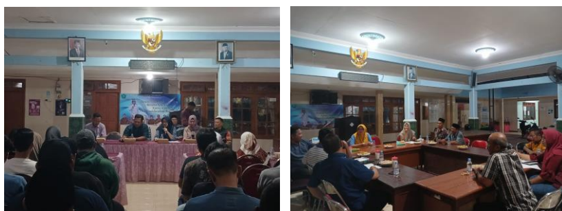
Gambar 2. Rapat Internal dan Musrenbangdes

Dari hasil wawancara tersebut dijelaskan bahwa ada beberapa kegiatan yang dilakukan oleh BPD diantaranya rapat koordinasi dan rapat musrenbangdes dengan Lembaga desa yang lain guna menentukan arah kebijakan suatu perdes. Berikut dokumentasi kegiatan rapat internal dan musrenbangdes yang dilakukan BPD Bersama dengan pemdes Kendalpecabean.