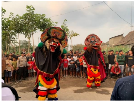
Gambar 2. Pertunjukan Jaranan Branasti Putro

Sebelum memulai pertunjukan H-1 minggu para pemain melakukan latihan di sanggar kesenian Jaranan Branasti Putro. latihan dilakukan pada malam hari dimulai pada jam 8 malam sampai selesai. Adapun penggunaan bahasa komunikasi ritual dalam pementasaan jaranan Branasti Putro terwujud dalam bentuk tarian, nyanyian dari sinden, musik seperti gamelan dan juga bunyi pecut.