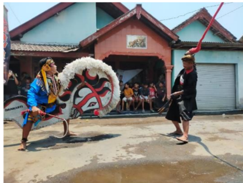
Gambar 1. Pertunjukan Jaranan Branasti Putro

Sedangkan sesi keempat atau sesi yang terakhir ada penampilan dari enam personil jaranan ditambah dengan barongan yang berjumlah tujuh sampai delapan barongan, sesi ini adalah sesi yang ditunggu tunggu oleh para penonton dimana para penonton dapat berinteraksi langsung dengan barongan bahkan bisa juga menyawer atau memberikan uang kepada barongan lewat mulut barongan sendiri.