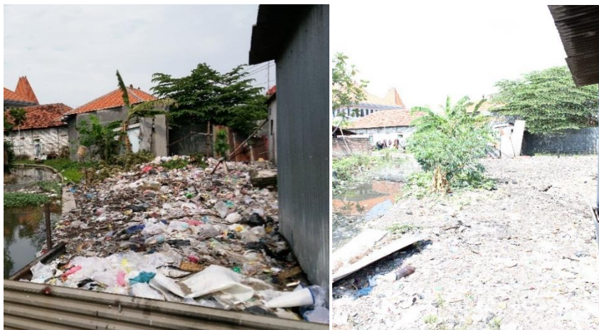
Gambar 1. Titik Buang sampah warga desa Wedoroklurak

Dari wawancara di atas dapat diketahui bahwasanya sampah merupakan salah satu masalah utama yang di keluhkan oleh warga Desa Wedoroklurak. Dan dapat diketahui juga bahwa pemerintah desa wedoroklurak tergerak setelah BPD menyampaikan aspirasi aspirasi yang diterima ketika ikut di forum perkumpulan lingkungan. Berikut dokumentasi permasalahan sampah yang belum tertangani dengan baik :