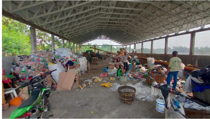
Gambar 3. TPST 3R Desa Wedoroklurak

Dari gambar 3 Peran sebagai fasilitator Pemerintah Desa Wedoroklurak dalam pengelolaan sampah sudah cukup baik. Dengan menyediakan sarana atau fasilitas untuk pengelolaan sampah yang menjadi salah satu masalah utama di Desa Wedoroklurak. TPST dengan lebar 10, panjang 32 meter serta disediakannya mesin confeyor dan mesin pemilah sampah, merupakan salah satu upaya pemerintah desa wedoroklurak dalam hal penanganan sampah. Hal ini berbading lurus dengan peran pemerintah sebagai fasilitator dalam teori Edy Suhardono. Pendekatan fasilitator ini juga didukung oleh penelitian sebelumnya yang dilakukan oleh Sri Hadiatmi (2011) yang berjudul "Pendukung Keberhasilan Pengelolaan Sampah Kota", yang menekankan pentingnya keterlibatan masyarakat dan pemangku kepentingan dalam pengelolaan sampah. Pemerintah Daerah juga memainkan peran penting sebagai komponen penentu kebijakan dengan membuat peraturan yang mewajibkan setiap kelurahan atau Pemerintah Desa memiliki tempat sebagai pusat pengelolaan sampah dan memfasilitasinya.