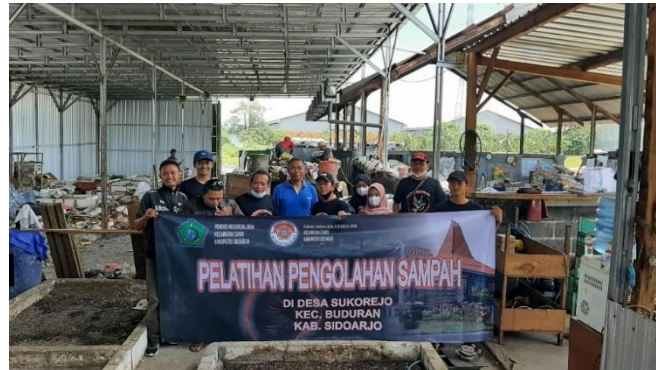
Gambar 4. Pelatihan Pengolahan Sampah

Berdasarkan wawancara di atas dapat diketahui bahwa langkah pemerintah Desa Wedoroklurak dalam menangani sampah dalam bentuk kegiatan pelatihan kepada masyarakat tentang kepedulian terhadap lingkungan inisiasi Kepala Desa Wedoroklurak dan ketua Rt di Desa Wedoroklurak. Karena langkah yang di ambil pemerintah Desa Wedoroklurak di anggap menyelesaikan masalah di sumber utamanya, berikut merupakan dokumentasi dari kegiatan kegiatan pemerintah desa Wedoroklurak sebagai mobilisator :