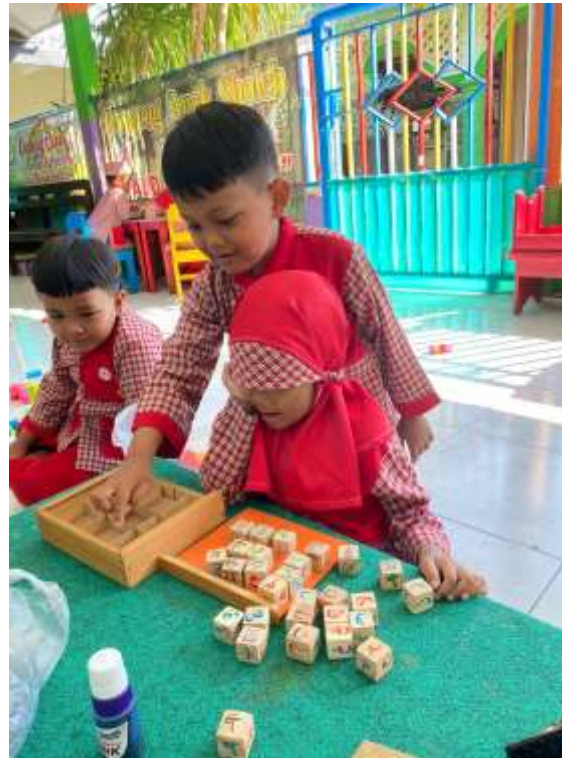
Kegiatan bermain BACERYAH