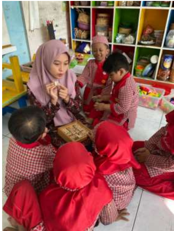
Kegiatan pengenalan huruf hijaiyyah melalui BACERYAH