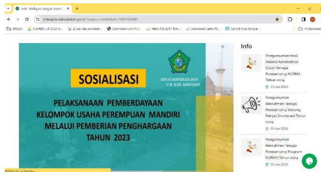
Gambar 2. Website Sosialisasi Program Bantuan Kelompok Usaha Perempuan Mandiri oleh Pemerintah Sidoarjo.

Dalam penelitian ini peneliti ingin melihat sejauh mana masyarakat mengerti akan program kegiatan yang disosialisasikan melalui website yang berisi tentang sosialisasi program bantuan kelompok usaha perempuan mandiri yang mencakup tentang pengertian program, kriteria pendaftar, dan jadwal pelaksanaan dari program tersebut.