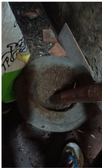
Penghalusan kotoran kambing