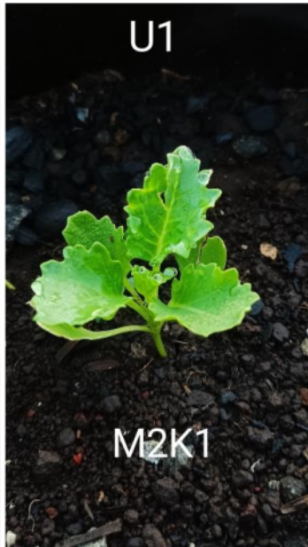
Kale umur 7 Hst