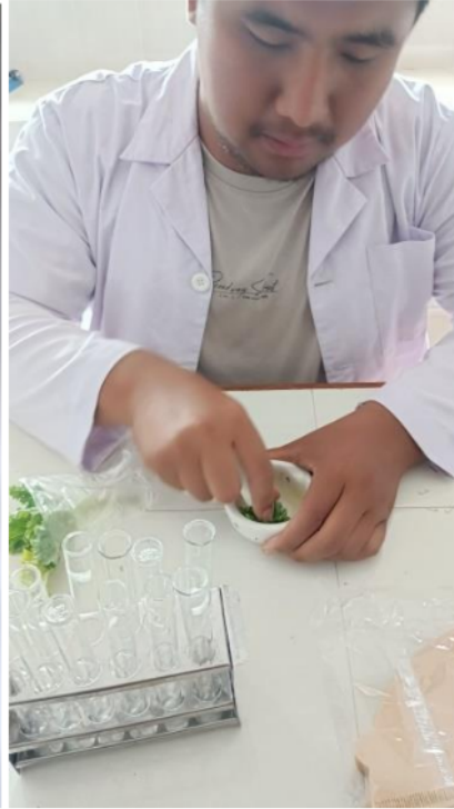
Uji laoratorium kadar klorofil