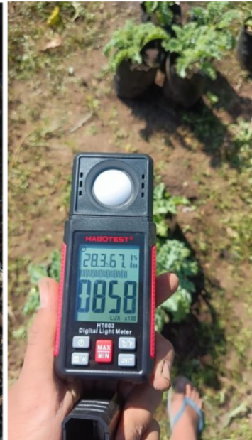
Pengukuran intensitas cahaya matahari