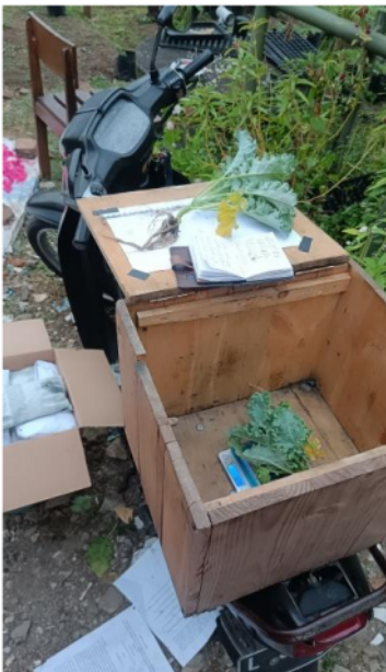
Pengukuran panjang akar dan berat basah