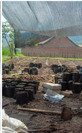
Pencampuran media tanam