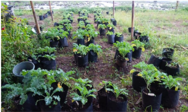
Kondisi lahan percobaan