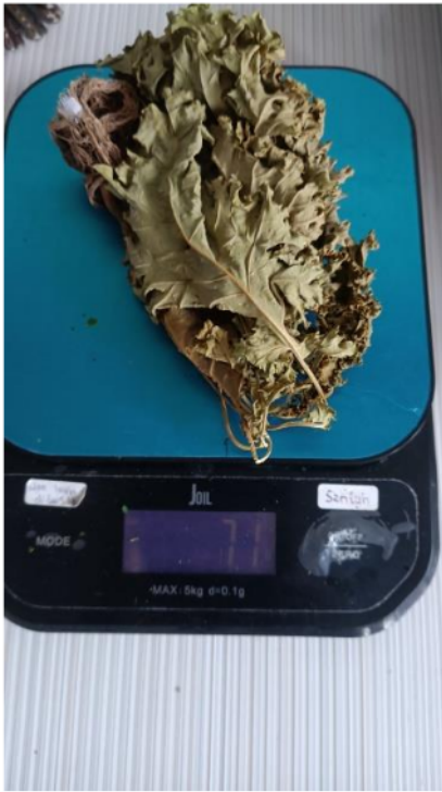
Penimbangan berat kering