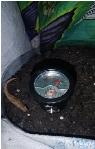
Pengukuran pH terra preta