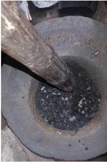
Penghalusan arang kayu