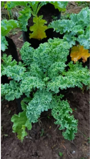
Kale umur 50 Hst