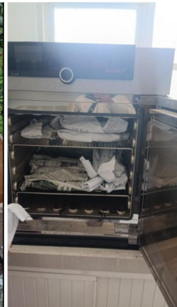
Uji laboratorium berat kering