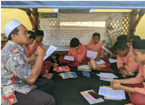
Gambar 3. Proses Penyebaran Angket Bahasa Arab