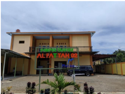
Gambar 1. Ponpes Tahfidz Muhammadiyah Al-Fattah