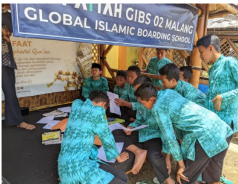
Gambar 5. Proses pembelajaran pemberian teks bahasa Arab