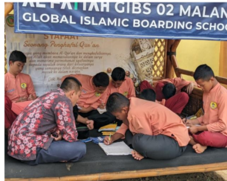
Gambar 2. Proses Pembelajaran Pembahasan Tugas Bahasa Arab