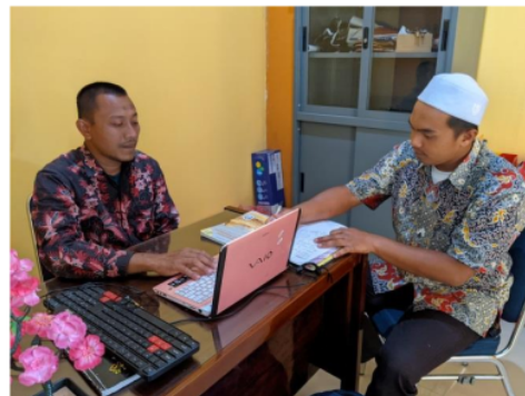
Gambar 4. Proses wawancara