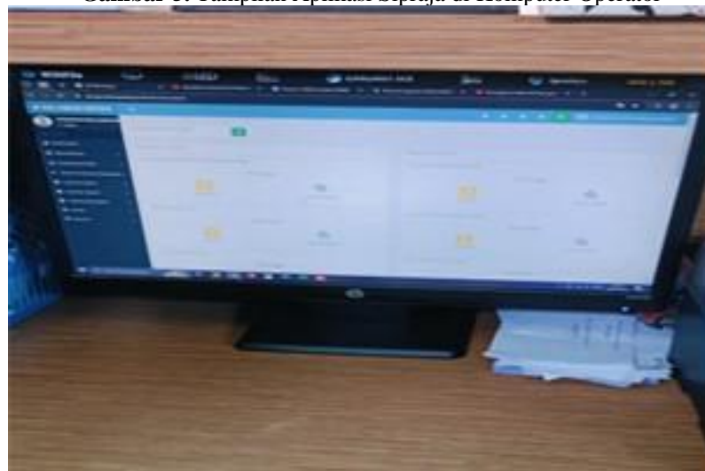
Gambar 5. Tampilan Aplikasi Sipraja di Komputer Operator

Kebijakan implementasi sistem informasi desa membutuhkan beberapa faktor pendukung yang menjadi kunci keberhasilannya. Selain anggaran dan waktu yang memadai, sarana dan prasarana yang cukup juga diperlukan. Untuk memastikan keberhasilan Implementasi Kebijakan, sarana prasarana yang memadai sangat diperlukan untuk memudahkan penyediaan pelayanan. Sarana yang termasuk di dalamnya meliputi komputer, gedung, buku, dan beberapa sarana lainnya Dengan fasilitas ini, implementasi kebijakan dapat berjalan dengan sebaik mungkin. Jika sarana dan prasarana yang tersedia sangat terbatas, maka akan berdampak pada rendahnya motivasi para pelaksana kebijakan, yang pada gilirannya dapat menyebabkan gagalnya Implementasi Kebijakan. Pemerintah Desa Siwalanpanji memiliki beberapa komputer untuk aplikasi Sipraja. Namun, komputer tersebut juga dibagi untuk mengurus hal-hal lain, dan untuk koneksi internet sangat stabil dan layak digunakan. Berikut adalah tampilan aplikasi Sipraja pada komputer operator sipraja di Desa Siwalanpanji.