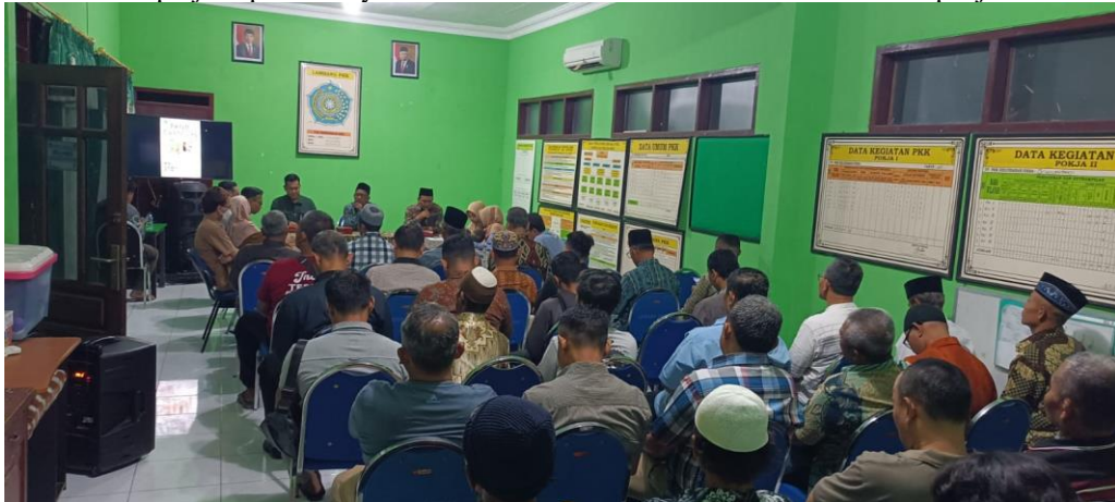
Gambar 2. Sosialisasi Sipraja kepada Masyarakat Melalui Ketua RT dan RW Desa Siwalanpanji Tahun 2023

Transmisi merujuk pada bagaimana informasi kebijakan disampaikan agar para pelaksana dapat memahami dan mengimplementasikannya dengan baik. Penyaluran informasi kebijakan secara berurutan dan sistematis dapat menjadikan implementasi yang berhasil pula. transmisi informasi kebijakan merupakan tahapan penting dalam implementasi kebijakan terutama dalam penggunaan aplikasi Sipraja. Sosialisasi program kebijakan perlu dilakukan dengan lebih intensif dan terus-menerus agar para pelaksana dapat memahami dan mengimplementasikan kebijakan dengan lebih efektif. Selain itu, pelatihan secara berkala diperlukan untuk memastikan para pelaksana kebijakan dapat menguasai penggunaan aplikasi yang diperlukan untuk memberikan pelayanan terbaik.