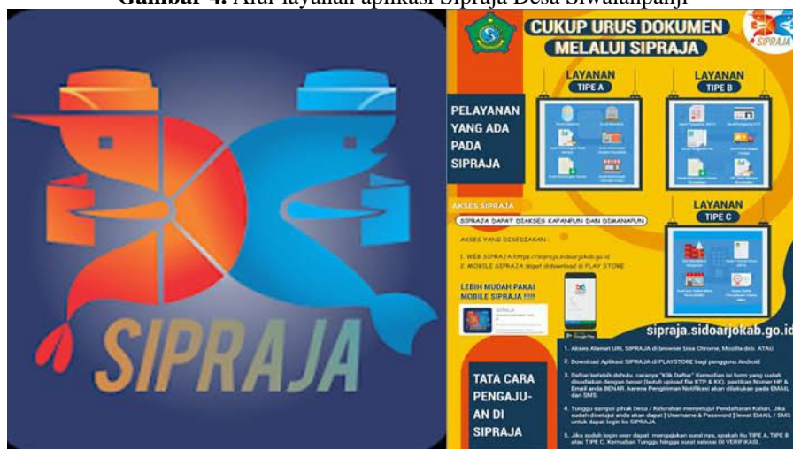
Gambar 4. Alur layanan aplikasi Sipraja Desa Siwalanpanji

Konsistensi sangat penting dalam implementasi kebijakan, terutama terkait dengan aturan yang konsisten dan jelas. Konsistensi akan memudahkan para pelaksana kebijakan dalam menjalankan kebijakan dan mencapai tujuan kebijakan yang diinginkan. Oleh karena itu, pembuat kebijakan dan pelaksana kebijakan harus saling terkait dan bekerja sama untuk menjaga konsistensi dalam setiap tahapan dari perencanaan hingga pelaksanaan. Konsistensi juga sangat penting dalam penerapan Aplikasi Sipraja, untuk mencapai tujuan memberikan pelayanan melalui sistem aplikasi sipraja secara maksimal dan efektif.