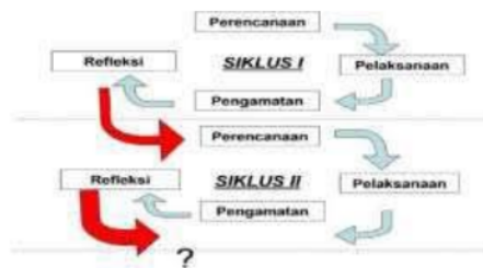
Gambar 1. Desain alur penelitian

Jenis metode yang digunakan dalam penelitian ini adalah metode penelitian tindakan kelas (Class action research), dimana metode tersebut dilakukan guna memecahkan masalah pembelajaran di lingkungan kelas. Pada penelitian ini menggunakan model Kemmis dan Taggart. Menurut Mulyatiningsih, terdapat 4 tahapan dalam metode ini, yaitu : (a) perencanaan (planning); (b) tindakan (acting); (c) pengamatan (observing); dan (d) refleksi (reflecting) (Mulyatiningsih).