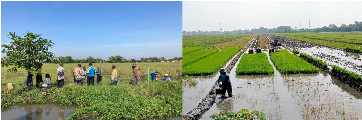
Gambar 1.3. Penyuluhan langsung pemerintah setempat ke persawahan

masyarakat bisa berjalan baik. Gapoktan didasari oleh visi yang diusung, bahwa pertanian modern tidak hanya identik dengan mesin pertanian yang modern tetapi perlu ada organisasi yang dicirikan dengan adanya organisasi ekonomi yang mampu menyentuh dan menggerakkan perekonomian di pedesaan melalui pertanian (Sekjen Deptan, 2006). Regulator merupakan Pemerintah menyiapkan arah untuk menyeimbangkan penyelenggaraan pembangunan (menerbitkan peraturan-peraturan dalam rangka efektifitas dan tertib administrasi pembangunan). Sebagai regulator, pemerintah memberikan acuan dasar yang selanjutnya diterjemahkan oleh masyarakat sebagai instrumen untuk mengatur setiap kegiatan pelaksanaan pemberdayaan di masyarakat. Pemberdayaan masyarakat dari segi ekonomi akan dikaitkan dengan kebijakan yang mendukung dalam pengembangan usahanya. Adapun kebijakan yang diarahkan yakni kebijakan dibidang permodalan guna mendukung kegiatan usaha masyarakat dan dianggarkan dari APBN/APBD dan kebijakan di bidang perizinan pendirian usaha untuk mempermudah proses perizinan menjadi lebih efektif dan efisien.