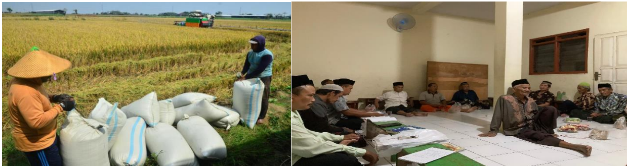
Gambar. 2.1. Musyawarah Petani Desa Bersama Pemerintah Desa Setempat Terkait Harga dan Hasil Panen Padi

dengan teori Sondang P, Siagian [14] menyatakan bahwa peran adalah tempat khusus yang diberikan kepada seseorang dalam proses mencapai tujuan. Memerintah negara atau badan tertinggi atau yang memerintah negara.