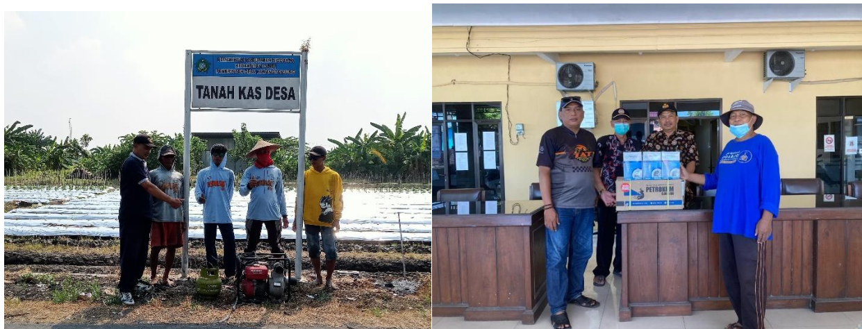
Gambar 1.4. Dokumentasi pertanian terkait adopsi teknologi

“kami para petani dikenalkan dengan berbagai mesin pertanian yang memang saya butuhkan, mulai pompa air, alat sortir pemrosesan padi, tractor dan lain sebagainya, sehingga kami lebih tau penggunaannya dan juga alat tersebut disediakan di kantor balaidesa dan kami bisa meminjam dan menggunakan sesuai dengan kebutuhan kami”