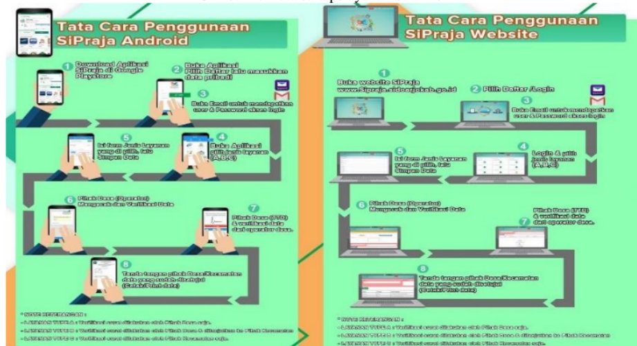
Gambar 2. Tata cara pelayanan SIPRAJA

dengan membuka www.Sipraja.sidoarjo.go.id . kemudian untuk cara yang kedua dengan cara mendownload aplikasi pada smartphone .