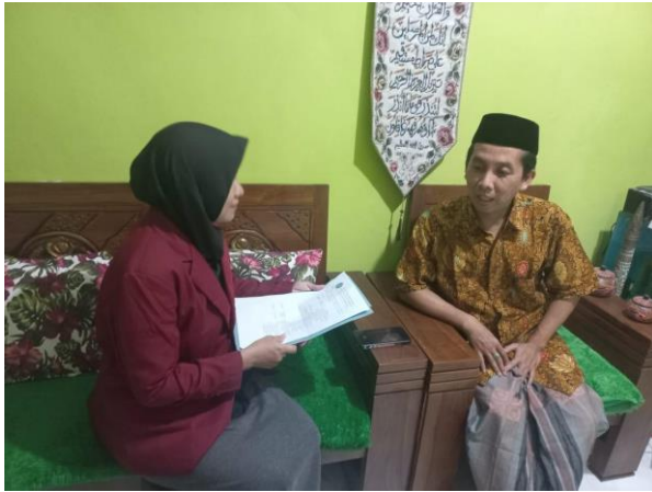
Wawancara Bersama Tokoh Masyarakat