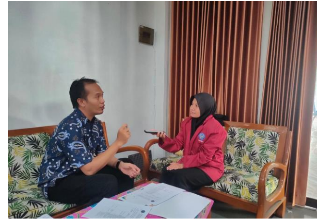
Wawancara Bersama Sekertaris Desa