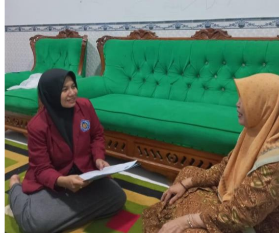
Wawancara Bersama Ibu Kepala Desa