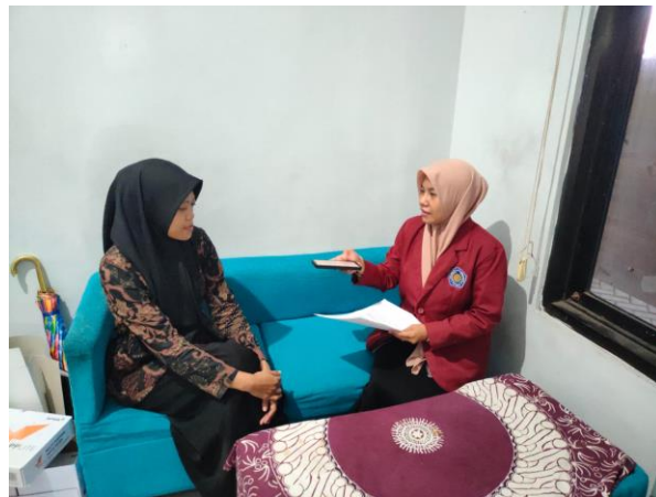
Wawancara Bersama Kaur Perencanaan