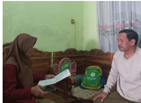
Wawancara Bersama Ketua RT 05