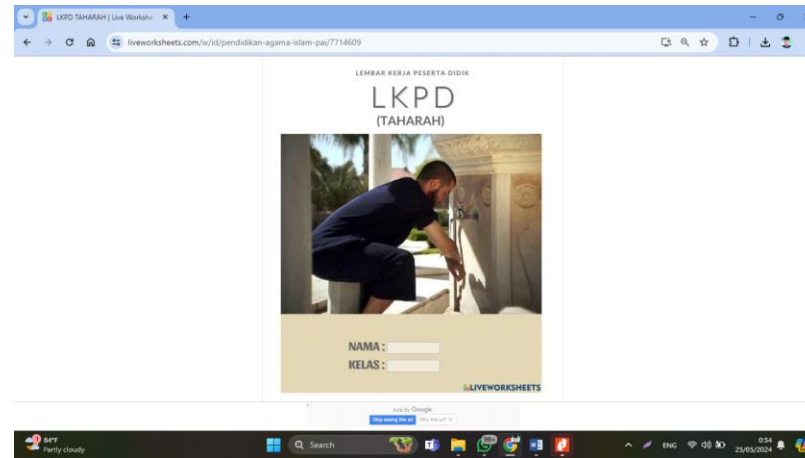
Gambar 2. Software Liveworksheets