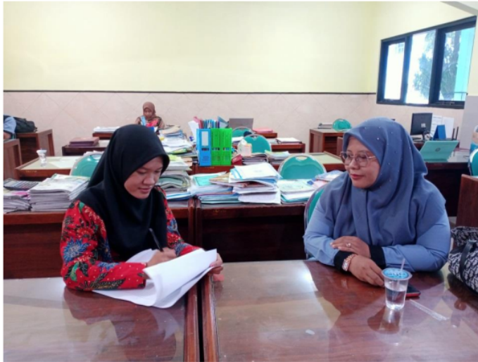
Gambar 1 : Wawancara bersama Guru PAI

Hasil dari penelitian menunjukkan bahwa dari materi ajar Qur'an Hadis dan sains Kelas XII dan X tentang menjaga kelestarian lingkungan dan keanekaragaman Hayati penelitian ini menggunakan model pembelajaran discovery learning yang berbasis permasalahan sehingga bagaimana siswa menyelesaikan masalah tersebut ditandai dengan kesadaran maupun kedisiplinan untuk melaksanakan piket sesuai dengan tanggung jawab masing-masing, membuang sampah pada tempatnya, mengajak orang lain untuk menjaga kelestarian lingkungan melalui berbagai media informasi seperti media sosial, sticker, dan juga poster.