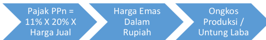
Gambar 2. Perhitungan Pajak PPN terhadap Harga Emas

6 Peraturan Menteri Keuangan (PMK) Nomor 48/PJ.03/2023 Menurut 6 pasal 1 ayat 4, Pajak Pertambahan Nilai (PPN) adalah jenis pajak tidak langsung yang diatur oleh undang-undang. PPN dikenakan pada setiap tahap produksi dan distribusi, mulai dari bahan baku hingga produk akhir yang dikonsumsi oleh masyarakat. Undang-Undang Pajak Pertambahan Nilai mengatur berbagai aspek terkait PPN, termasuk objek pajak, tarif, mekanisme pemungutan, pelat 13 n, serta hak dan kewajiban Wajib Pajak. Tujuan pengaturan ini adalah untuk menciptakan sistem pemungutan PPN yang efektif dan efisien, sehingga dap 13 meningkatkan penerimaan negara dari sektor pajak. Selain itu, penerapan PPN juga dimaksudkan untuk mendorong kepatuhan Wajib Pajak dalam memenuhi kewajiban perpajakannya 14 .