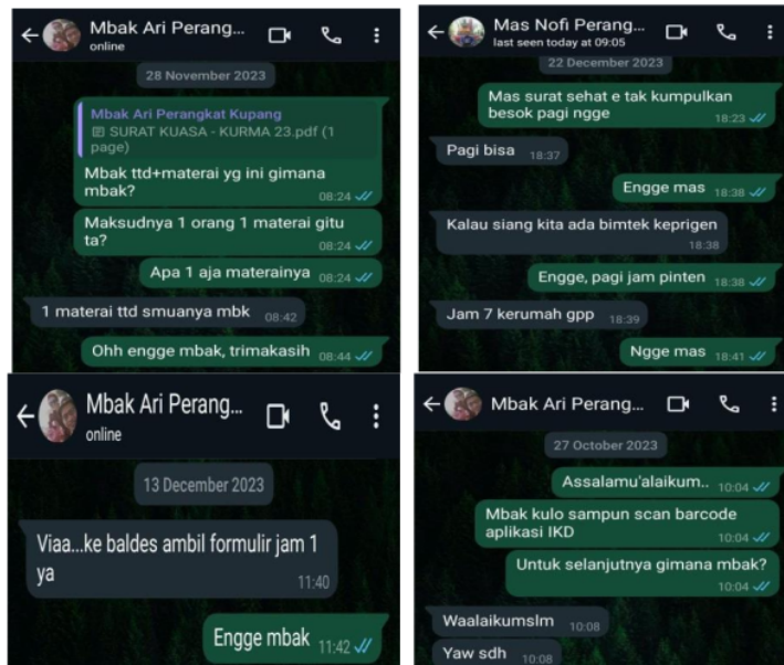
Gambar 2. Alternatif Komunikasi yang Berlaku di Kantor Desa Kupang

Menurut penulis, komunikasi yang baik adalah pembicaraan yang tersampaikan secara lugas dan efektif agar secara mudah dipahami oleh lawan bicara. Komunikasi yang baik terdiri dari keterampilan dalam mendengar inti dari pembicaraan, menunjukkan kepedulian dan rasa hormat terhadap pembicara maupun pendengar, menggunakan bahasa yang mudah dipahami dan tutur kata yang sopan. Inovasi dalam berkomunikasi merupakan hal yang sangat penting. Pegawai di Kantor Desa Kupang mengembangkan inovasi dalam komunikasi secara perlahan. Ide serta gagasan akan terus dikembangkan dan dikaji hingga menumbuhkan inovasi terbaru dalam komunikasi. Hal tersebut bertujuan untuk mempererat jalinan komunikasi antar pegawai dan juga komunikasi antara pegawai dengan masyarakat.