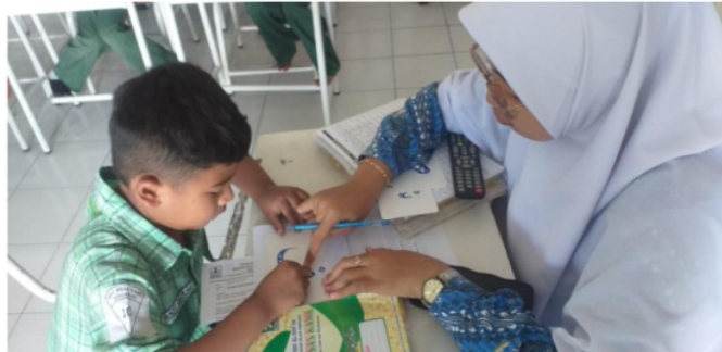
Gambar 2. Proses pembelajaran secara individual

Setelah seluruh proses dalam penggunaan metode multisensory dilakukan secara klasikal, guru memulai pembelajaran secara individual dengan memanggil satu per satu siswa duduk di depan guru. Hal ini dilakukan untuk menguatkan materi yang disampaikan hari ini. Setelah seluruh proses metode multisensory dilakukan, pembelajaran beralih pada buku mengaji jilid 3 metode UMMI.