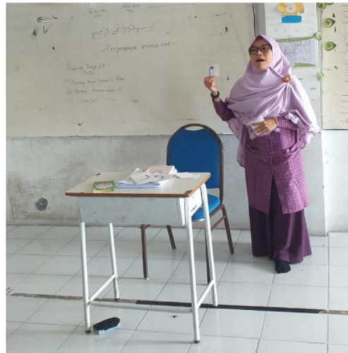
Gambar 1. Proses pembelajaran secara klasikal

Metode multisensori merupakan salah satu metode pembelajaran yang dapat diterapkan pada siswa disleksia dan autisme. Penggunaan metode multisensori pada proses pembelajaran dapat melibatkan dan mengaktifkan seluruh sensori pada siswa yang dapat disingkat dengan VAKT (Visual, Audio, Kinestetik, dan Tactil) yaitu berupa penglihatan, pendengaran, indera raba, dan gerakan-gerakan yang ada[10]. Dalam penerapan metode multisensori pada saat pembelajaran Al Qur'an di SDIT Insan Kamil, guru menggunakan kartu huruf sensori berbahan dasar kertas karton dengan huruf hijaiyah berwarna kontras dan timbul. Pemilihan warna dan bahan dimaksudkan untuk memaksimalkan sensor raba dan sensor penglihatan.