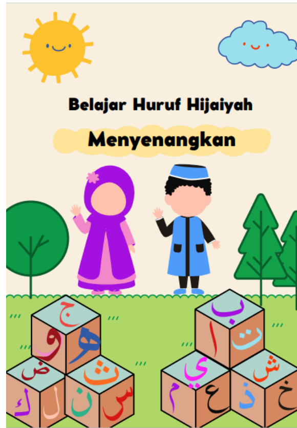
Cover Depan Busy Book