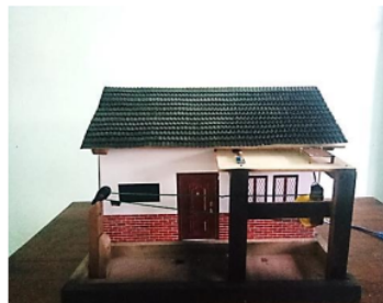
Gambar 2 Bentuk Alat