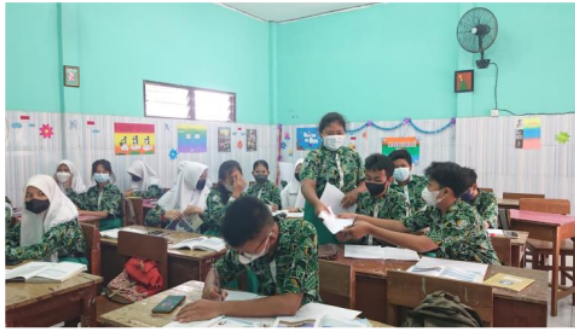
Gambar 1 : kegiatan pembelajaran

Kedua, assesmen formatif dilakukan secara berkelanjutan selama proses pembelajaran untuk memantau kemampuan belajar peserta didik. Di SMPN 3 Sidoarjo, guru PAI menggunakan evaluasi formatif dalam bentuk projek atau portofolio yang diberikan kepada peserta didik baik secara individu maupun kelompok sesuai dengan topic yang dibahas. Ketiga, Assesmen Sumatif merupakan penilaian terhadap hasil belajar peserta didik yang dilakukan pada pertengahan semester (PTS) maupun pada akhir semester (PAS), guru PAI menggunakan berbagai instrument assesmen dalam evaluasi sumatif, termasuk tes tulis dan projek.