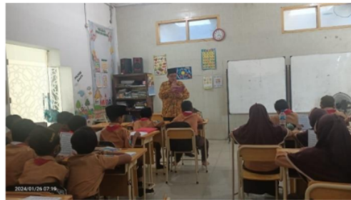
Gambar 3. Kegiatan Pengulangan dan Memberikan Umpan Balik

Sebagian besar peserta didik menunjukkan partisipasi aktif dalam kegiatan pembelajaran. Mereka menunjukkan minat tinggi terhadap metode tilawati, dan adanya peningkatan motivasi untuk menghafal dan membaca Al-Qur'an dengan baik. Respon positif juga ditemukan dalam peningkatan pemahaman terhadap makna ayat-ayat Al-Qur'an, yang dianggap sebagai hasil dari pengulangan dan penghayatan dalam pembacaan.