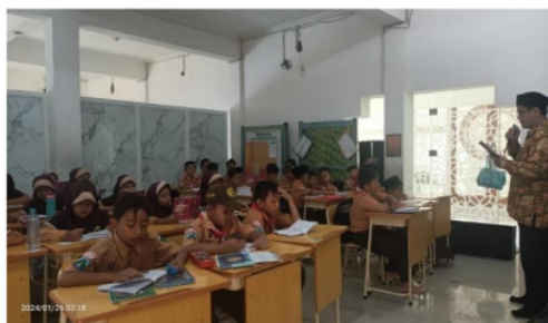
Gambar 2. Penggunaan Media Pembelajaran Metode Tilawati

Ditemukan bahwa MI Ma'arif Pagerwojo telah melaksanakan metode tilawati dengan sungguh-sungguh. Guru-guru memahami prinsip-prinsip dasar metode ini, termasuk penekanan pada pengulangan, intonasi, dan penghayatan dalam membaca AI-Qur'an. Terdapat variasi kegiatan pembelajaran, seperti penggunaan media pembelajaran yang mendukung, seperti audio rekaman tilawati yang menggambarkan bacaan yang benar.