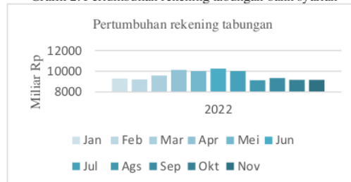
Grafik 2. Pertumbuhan rekening tabungan bank syariah

share perbankan syariah sebesar 6,78% terhadap keuangan nasional dan mengalami sedikit peningkatan dari tahun 2021 sebesar 6,51% (Syariah 2021). Dapat pula dilihat dari pertumbuhan rekening nasabah perbankan syariah dan jumlah pembiayaan yang diterima oleh perbankan syariah (Syariah 2022).