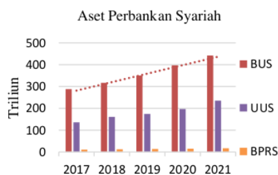
Grafik 1. Perkembangan Aset Perbankan Syariah

Potensi perkembangan perbankan syariah di Jawa Timur sangat besar, disebabkan karena jumlah penduduk Jawa Timur yang beragama Islam sebanyak 97,21% (39,85 juta jiwa) dari keseluruhan penduduk Jawa Timur sebanyak 40,994 juta jiwa. Besarnya potensi perkembangan perbankan syariah di Jawa Timur ternyata tidak seiring dengan pertumbuhan aset bank syariah.