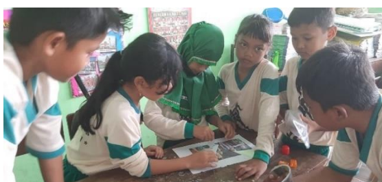
Gambar 5 Kegiatan pembelajaran P5

Tujuan dari penguatan karakter religius peserta didik di lingkungan sekolah yaitu untuk memfasilitasi pembentukan karakter dalam diri peserta didik dengan berbagai kegiatan beragama dan pembiasaan-pembiasaan yang sudah ditetapkan oleh SDN Sedati Agung [14]. Melalui karakter religius dapat melahirkan para generasi baru dengan akhlak lebih baik sehingga mempengaruhi sumber daya manusia lebih berkualitas. Karakter religius terintegrasi melalui profil pelajar Pancasila dengan enam dimensi antara lain: beriman dan bertakwa kepada Tuhan yang Maha Esa, dan berakhlak mulia, berkebhinekaan global, bergotong royong, mandiri, bernalar kritis, serta kreatif [2]. Dalam kurikulum merdeka terdapat aspek Profil Pelajar Pancasila di dalamnya, yang bertujuan sebagai pembentukan karakter serta kompetensi terhadap nilai-nilai Pancasila pada peserta didik. Salah satu dimensi yang ada dalam profil pelajar Pancasila digunakan sebagai sarana dalam penguatan karakter religius peserta didik di SDN Sedati Agung [31].