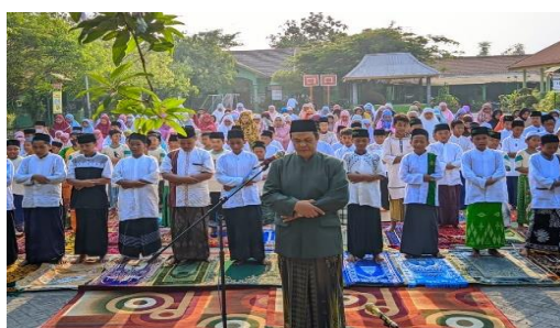
Gambar 4 Kegiatan rutin sholat dhuha dan dhuhur berjamaah

Kegiatan pembiasaan pelaksanaan ibadah di lingkungan SDN Sedati Agung Sidoarjo, bertujuan agar membentuk karakter para generasi penerus dengan mendirikan pondasi agama sejak dini pada diri peserta didik. Kegiatan pelaksanaan ibadah di lingkungan sekolah dasar negeri sudah berjalan mulai satu tahun lalu yang saat ini di implementasikan pada kelas atas (4,5,6). Hal ini senada dengan apa yang sudah dijelaskan oleh [28] untuk membentuk dasar pondasi karakter keimanan pada diri anak melalui lingkungan yang mendukung salah satunya yaitu lingkungan sekolah, serta penanaman nilai nilai Pancasila sejak dini pada anak, sehingga dapat mendukung dalam pembentukan dan penguatan karakter religious peserta didik. Melalui pembiasaan pelaksanaan ibadah di lingkungan sekolah para pendidik berharap nantinya akan berdampak baik untuk kehidupan peserta didik di kemudian hari.