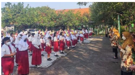
Gambar 3 Doa bersama secara sentral sebelum memulai pembelajaran

cara dalam menguatkan karakter religious peserta didik melalui nilai Pancasila, dan mengajarkan agar semua dalam setiap kegiatan yang akan dilakukan mendapatkan kelancaran serta kemudahan. Menurut [25] melalui pembiasaan berdoa sebelum dan sesudah pembelajaran tersebut bertujuan untuk mengajarkan peserta didik ketika akan mengawali dan mengakhiri kegiatan dapat selalu mengharapkan ridho dari Allah SWT, penerapan berdoa sebelum dan sesudah pembelajaran sudah sesuai dengan penerapan dan pembiasaan yang ada di SDN Sedati Agung sehingga peserta didik juga dapat menerapkan nilai nilai Pancasila dalam setiap kegiatan.