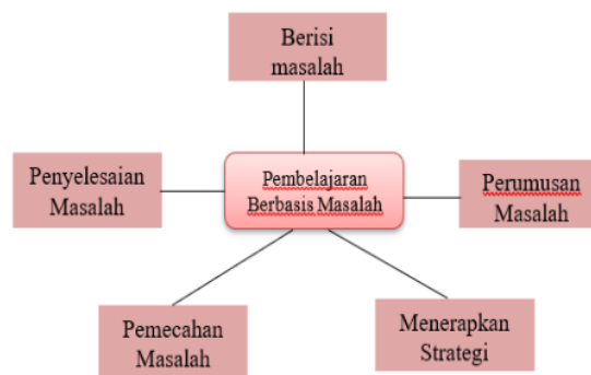
GAMBAR 2. INDIKATOR PEMBELAJARAN BERBASIS MASALAH

Kemampuan memecahkan masalah dan pemecahan masalah merupakan suatu proses yang ditempuh oleh seseorang untuk menyelesaikan masalah yang dihadapinya hingga masalah itu tidak lagi menjadi masalah baginya. Dua hal yang mampu mendukung arah penguasaan matematika untuk peserta didik, yaitu: 1) Matematika diperlukan untuk alat bantu dalam memahami terjadinya peristiwa alam dan sosial, dan 2) Matematika termasuk dalam aktivitas hidup manusia, baik untuk keperluan sehari-hari maupun untuk keperluan profesional[17]. Pada pembelajaran matematika, penggunaan model pembelajaran berbasis masalah bisa di implementasikan dengan penggunaan soal cerita. Adapun indikator pembelajaran berbasis masalah adalah sebagai berikut: