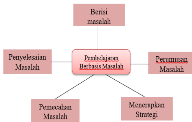
GAMBAR 2. INDIKATOR PEMBELAJARAN BERBASIS MASALAH

Kemampuan memecahkan masalah dan pemecahan masalah merupakan suatu proses yang ditempuh oleh seseorang untuk menyelesaikan masalah yang dihadapinya hingga masalah itu tidak lagi menjadi masalah baginya. Dua hal yang mampu mendukung arah penguasaan matematika untuk peserta didik, yaitu: 1) Matematika diperlukan untuk alat bantu dalam memahami terjadinya peristiwa alam dan sosial, dan 2) Matematika termasuk dalam aktivitas hidup manusia, baik untuk keperluan sehari-hari maupun untuk keperluan profesional[17]. Pada pembelajaran matematika, penggunaan model pembelajaran berbasis masalah bisa di implementasikan dengan penggunaan soal cerita. Adapun indikator pembelajaran berbasis masalah adalah sebagai berikut: