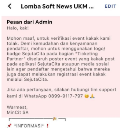
Gambar 2. Informasi Event Palsu yang Mengatasnamakan Aplikasi Sejuta Cita

Hal tersebut telah melanggar pasal 28 UU ITE yang mana mengatur tentang pengawasan terhadap kegiatan informasi dan transaksi elektronik. Pengawasan dilakukan oleh Pemerintah untuk memastikan keamanan, integritas, dan keamanan data serta transaksi elektronik. Pengawasan dilakukan dengan cara membuat peraturan perundang-undangan, standar, dan prosedur, serta melakukan pengawasan terhadap kegiatan informasi dan transaksi elektronik.