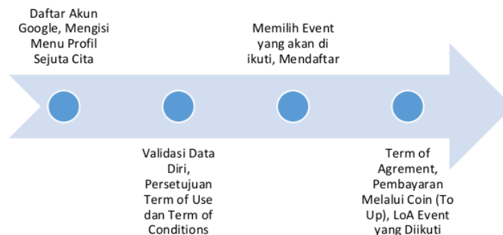
Gambar 1. Alur Pendaftaran Event pada Platform Sejuta Cita

Setelah mengetahui alur prosedur pendaftaran, Klausula-klausula dalam Term of Conditions yang terdapat pada platform Sejuta Cita mengatur hak, kewajiban, dan tanggung jawab antara pengguna (Pengguna atau Anda) dengan penyedia platform (PT SejutaCita Anak Muda Indonesia dan/atau Yayasan SejutaCita Pendidikan Indonesia). Ketentuan ini mengatur berbagai aspek yang terkait dengan penggunaan platform, hak kekayaan intelektual, tanggung jawab pengguna, kebijakan privasi, serta perubahan ketentuan. Klausula pertama menetapkan bahwa penggunaan platform tunduk pada persetujuan dan pemahaman pengguna terhadap ketentuan-ketentuan ini [12].