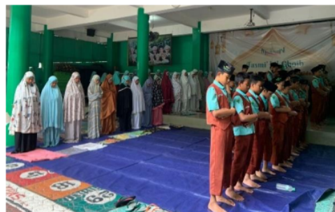
GAMBAR 4. PEMBIASAAN SHOLAT BERJAMAAH