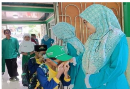
GAMBAR 2. PEMBIASAAN 5S

Berdasarkan hasil pengamatan, pembiasaan kegiatan 5S dilakukan dengan cara peserta didik memasuki wilayah madrasah dengan disambut guru di sisi dalam gerbang madrasah. Setelah itu menyapa peserta didik dengan ramah. Dilanjutkan dengan peserta didik yang mengucapkan salam dan mencium punggung tangan guru dengan sopan santun. Budaya 5S dapat membiasakan peserta didik untuk berjabat tangan terhadap guru dan kepala sekolah. Nilai-nilai ini akan tertanam pada anak saat mengucapkan salam dan mencium tangan orang tuanya dengan sopan santun ketika hendak pergi ke sekolah [19]. Selama pembiasaan kegiatan 5S dilakukan dengan baik, maka akan memunculkan energi positif saat proses pembelajaran berlangsung.