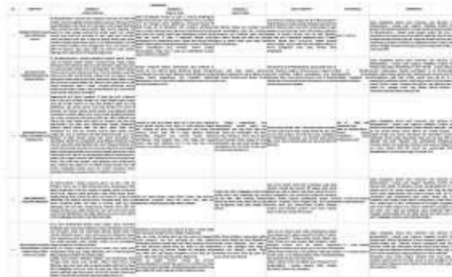
Tabel 2. Triangulasi Teknik

Pendidikan karakter di lingkungan sekolah merupakan upaya yang dilakukan oleh semua pihak di sekolah untuk membentuk karakter pada peserta didik, sehingga karakter tersebut menjadi kebiasaan yang melekat. Lembaga pendidikan di Indonesia terbagi menjadi dua jenis, yaitu lembaga pendidikan agama dan umum. Tujuannya untuk Menumbuhkan akidah islam melalui pembiasaan dan pengalaman siswa, Mewujudkan manusia yang taat beragama dan berakhlakul karimah.