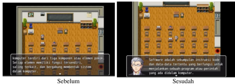
Gambar 8. Revisi Materi Software

Tahap ketujuh yaitu revisi produk, setelah melakukan uji coba pada siswa terdapat beberapa masukan yaitu untuk menambahkan materi software agar lebih menarik. Tujuan revisi produk ini adalah untuk memperbaiki game edukasi yang telah dilakukan uji coba sebelumnya guna untuk menghasilkan game edukasi Siskom yang lebih menarik.