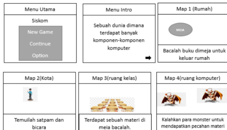
Gambar 2. Storyboard Game Siskom

Tahap ketiga, tahap desain produk membuat storyboard untuk menentukan tampilan game edukasi yang akan dibuat. Dimulai dari menentukan struktur isi yang ada di dalam game , memilih bahan materi, soal, dan konten yang menarik. Cerita di dalam game dibuat lebih menarik dan disesuaikan dengan tujuan pembelajaran. Storyboard yang dibuat serta produk yang dihasilkan ditunjukkan pada Gambar 1.