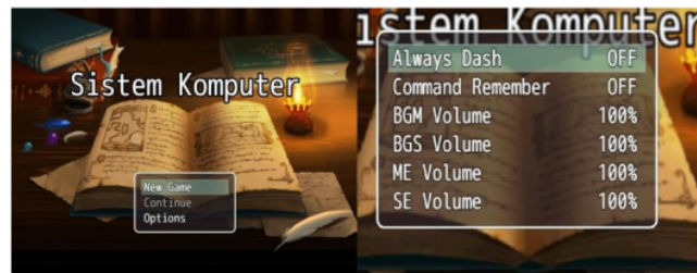
Gambar 3. Halaman Tampilan Utama

Pembuatan game siskom dilakukan setelah tahap desain telah selesai. Pada tahap pembuatan ini menggunakan software RPG MAKER MV, software ini menggunakan javascript yang digunakan untuk membuat game ini berjalan sesuai dengan perintah yang telah dibuat. Dalam tampilan utama ini merupakan tampilan pada pengguna android yang terdapat judul aplikasi dan tombol yang telah disediakan. Tombol tersebut diantaranya meliputi new game sebagai awal permainan, tombol continue yaitu melanjutkan game sebelumnya yang telah disimpan, dan tombol option yaitu untuk mengatur besar atau kecilnya musik.