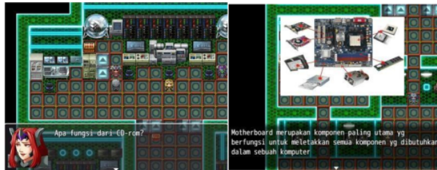
Gambar 6. Tampilan Evaluasi Soal

Gambar 5 yaitu bagian evaluasi soal ini pemain akan melawan 5 monster, dimana setiap monster akan memberikan pertanyaan sebagai evaluasi. Ketika pemain menjawab pertanyaan dari monster dengan benar maka pemain akan mendapatkan materi yang berisikan pecahan komponen computer yang berjumlah 12 dan setiap menjawab benar melawan monster maka akan mendapatkan materi secara random 3-4 komponen komputer.