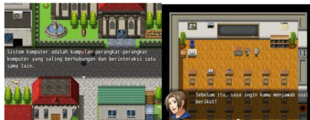
Gambar 5. Materi dan Soal

Gambar 3 menunjukkan pemain akan mengisi nama sebelum bermain dan terdapat halaman petunjuk penggunaan mulai dari menunjukkan suatu lokasi map agar pemain tidak kebingungan untuk melanjutkan permainan. Tampilan ini merupakan Map 1 area rumah sebelum pergi ke kota untuk mencari petunjuk selanjutnya.