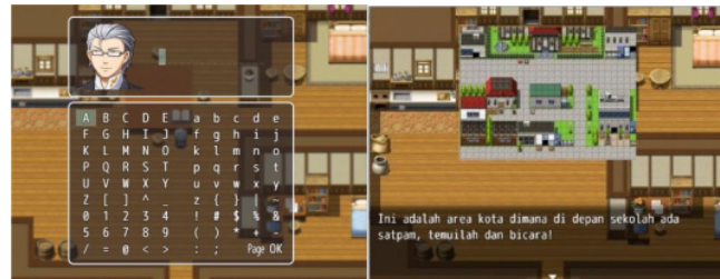
Gambar 4. Input Nama dan Petunjuk

Pembuatan game siskom dilakukan setelah tahap desain telah selesai. Pada tahap pembuatan ini menggunakan software RPG MAKER MV, software ini menggunakan javascript yang digunakan untuk membuat game ini berjalan sesuai dengan perintah yang telah dibuat. Dalam tampilan utama ini merupakan tampilan pada pengguna android yang terdapat judul aplikasi dan tombol yang telah disediakan. Tombol tersebut diantaranya meliputi new game sebagai awal permainan, tombol continue yaitu melanjutkan game sebelumnya yang telah disimpan, dan tombol option yaitu untuk mengatur besar atau kecilnya musik.