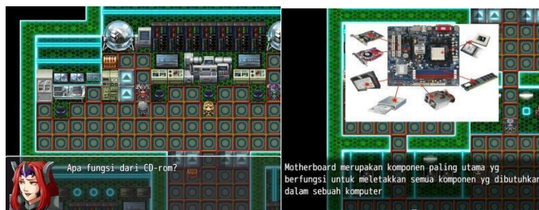
Gambar 6. Tampilan Evaluasi Soal

Gambar 5 yaitu bagian evaluasi soal ini pemain akan melawan 5 monster, dimana setiap monster akan memberikan pertanyaan sebagai evaluasi. Ketika pemain menjawab pertanyaan dari monster dengan benar maka pemain akan mendapatkan materi yang berisikan pecahan komponen computer yang berjumlah 12 dan setiap menjawab benar melawan monster maka akan mendapatkan materi secara random 3-4 komponen komputer.