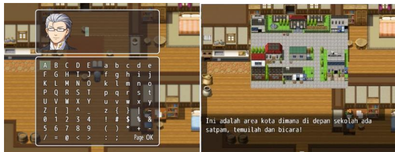
Gambar 4. Input Nama dan Petunjuk

Pembuatan game siskom dilakukan setelah tahap desain telah selesai. Pada tahap pembuatan ini menggunakan software RPG MAKER MV, software ini menggunakan javascript yang digunakan untuk membuat game ini berjalan sesuai dengan perintah yang telah dibuat. Dalam tampilan utama ini merupakan tampilan pada pengguna android yang terdapat judul aplikasi dan tombol yang telah disediakan. Tombol tersebut diantaranya meliputi new game sebagai awal permainan, tombol continue yaitu melanjutkan game sebelumnya yang telah disimpan, dan tombol option yaitu untuk mengatur besar atau kecilnya musik.