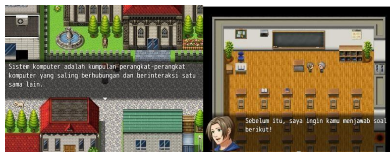
Gambar 5. Materi dan Soal

Gambar 3 menunjukkan pemain akan mengisi nama sebelum bermain dan terdapat halaman petunjuk penggunaan mulai dari menunjukkan suatu lokasi map agar pemain tidak kebingungan untuk melanjutkan permainan. Tampilan ini merupakan Map 1 area rumah sebelum pergi ke kota untuk mencari petunjuk selanjutnya.