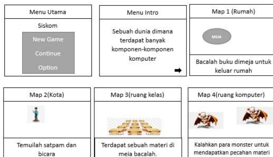
Gambar 2. Storyboard Game Siskom

Tahap ketiga, tahap desain produk membuat storyboard untuk menentukan tampilan game edukasi yang akan dibuat. Dimulai dari menentukan struktur isi yang ada di dalam game , memilih bahan materi, soal, dan konten yang menarik. Cerita di dalam game dibuat lebih menarik dan disesuaikan dengan tujuan pembelajaran. Storyboard yang dibuat serta produk yang dihasilkan ditunjukkan pada Gambar 1.