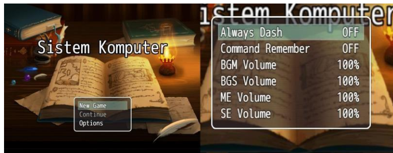
Gambar 3. Halaman Tampilan Utama

Pembuatan game siskom dilakukan setelah tahap desain telah selesai. Pada tahap pembuatan ini menggunakan software RPG MAKER MV, software ini menggunakan javascript yang digunakan untuk membuat game ini berjalan sesuai dengan perintah yang telah dibuat. Dalam tampilan utama ini merupakan tampilan pada pengguna android yang terdapat judul aplikasi dan tombol yang telah disediakan. Tombol tersebut diantaranya meliputi new game sebagai awal permainan, tombol continue yaitu melanjutkan game sebelumnya yang telah disimpan, dan tombol option yaitu untuk mengatur besar atau kecilnya musik.