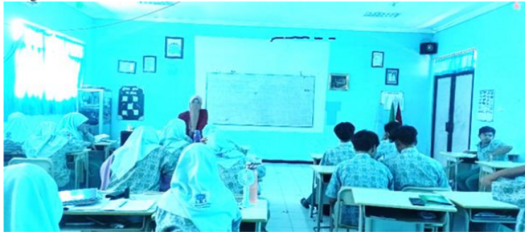
Gambar.3 Kegiatan Pembelajaran Nahwu Berbasis Metode Bernyanyi di Kelas

c) Bernyanyi secara bersama-sama dan perorangan : Setelah menuliskan lagu di papan, guru meminta siswa untuk memperhatikan dengan seksama lirik lagu yang telah di tuliskan, kemudian guru mencontohkan dengan menyanyikan lagu tersebut sebanyak 3-4 kali sehingga mereka terbiasa mendengarkannya. Setelah para siswa mendengarkan contoh pelafalan lirik lagu dengan baik, guru dan siswa mulai menyanyikan lirik lagu secara bersama-sama dan diulangi sebanyak 3 kali, selanjutnya guru menunjuk beberapa siswa untuk mengulangi nyanyian tersebut secara bergantian. 3. Penutup : sebelum guru menutup pembelajaran di kelas, guru bertanya kepada siswa apakah materi macam-macam khobar terkait pengertian kaidah dan contoh membuat kalimat dapat difahami atau belum. Apabila siswa belum memahami materi tersebut guru memberikan penjelasan ulang, dan apabila siswa dirasa sudah faham selanjutnya guru memberikan kesimpulan materi tersebut dan menutup pembelajaran dengan membaca hamdalah secara bersama-sama kemudian ditutup dengan salam.