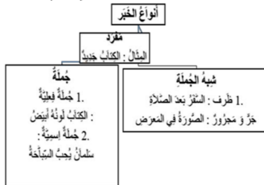
Gambar.2 Materi Macam-macam Khabar

a) Penyampaian materi : Pada tahap awal sebelum mulai menjelaskan materi baru, guru mengajak siswa untuk mengulang kembali materi nahwu yang telah diajarkan sebelumnya yaitu terkait materi muftada dan khabar, dengan tujuan untuk mengetahui pemahaman siswa terhadap materi tersebut sehingga memudahkan siswa dalam memahami materi baru. Selanjutnya guru menjelaskan materi terkait macam-macam khabar yang diantaranya adalah pengertian khabar mufrod, khabar jumlah, khabar syibbul jumlah beserta contoh kalimat.