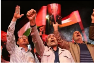
Gambar 1.2. ribuan warga Iran membawa bendera untuk mendukung Hamas dan Palestina.

Gambar di atas menunjukkan dukungan Iran terhadap perlawanan yang dilakukan Hamas dan Palestina, wartawan memberikan gambar tersebut karena ingin memberikan pesan bahwa banyak Masyarakat diluar Palestina yang dengan gencar memberikan dukungan kepada Palestina.