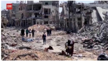
Gambar 2.4. Hamas rilsis video seorang sandera Israel-Amerika di Gaza

Dari foto tersebut wartawan ingin menyampaikan keadaan di Gaza yang Dimana itu juga tempat menyandra para warga Israel agar kita tu bagaimana kondisi Gaza saat ini.