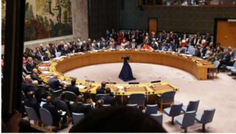
Gambar 2.1. DKPBB mengeluarkan putusan untuk gencatan senjata antara Hamas dan Israel.

DK PBB mengeluarkan putusan terkait gencatan senjata dan pertukaran sandera, wartawan memberikan foto diatas karena ingin menyampaikan bahwa putusan ini benar benar dilakukan dengan serius agar gencatan senjata dan pertukaran sandera bisa benar benar terlaksana.