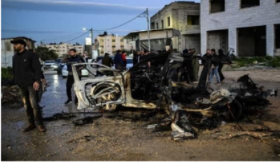
Gambar 1.1. Kumpulan pemuda palestina yang berkumpul mobil yang hancur akibat serangan udara Israel.

Gambar di atas mendeskripsikan pemuda Palestina yang sedang berkumpul di sekitaran mobil yang rusak/hancur yang diakibatkan serangan udara Israel pada jenin di tepi barat, dengan gambar itu wartawan ingin menyampaikan bahwa serangan Israel benar benar tidak main main sampai mobil di buat tidak berbentuk seperti itu.