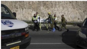
Gambar 2.3 aparat Israel membawa pasien di Yerusalem Timur.

Israel membawa pasien Yerusalem Timur disini wartawan memberikan gambar agar kita bisa mengetahui betapa kejamnya pemindahan paksa itu, bahkan pasien yang masih terbaring lemah pun dengan paksa di pindahkan ke Gaza.