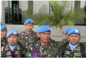
Gambar 1.4. PMPP TNI laksamana Muda Retiono Kunto (Tengah depan) di Plaza markas besar TNI.

TNI Laksamana Muda Retiono Kunto dari pasukan perdamaian, di plaza markas besar TNI, foto itu berisikan laporang yang di terima langsung dari Agus Subyanto terkait keadaan yang terjadi di wilayah Lebanon Selatan.