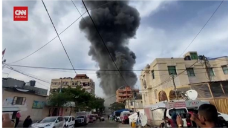
Gambar 2.5. meningkatnya serangan Israel di seluruh wilayah Gaza dan memberi himbuan untuk para warga melakukan evakuasi di bagian Utara.

Israel telah meningkatkan intensitas serangan di seluruh jalur Gaza dan meminta penduduk di bagian utara wilayah tersebut untuk segera melakukan evakuasi. Tujuan wartawan memaparkan gambar tersebut karena dia ingin menyampaikan bahwa peningkatan serangan yang dilakukan oleh Israel bukanlah main main mereka benar benar melakukan serangan secara membabi buta.