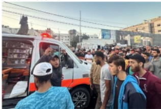
Gambar 1.3. segerombolan orang berkumpul di ambulance yang rusak dikarenakan serangan Israel.

Gambar tersebut mendeskripsikan bahwa orang-orang berkumpul di ambulans yang hancur karena tindakan penyerangan Israel, bisa di bilang gambar tersebut mengartikan ke brutalan yang dilakukan Israel pada serangan balasan tersebut yang membuat rumah sakit pun keteteran, karena jumlah korban yang tidak sedikit.