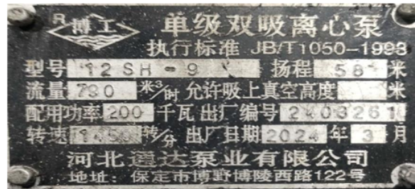
Gambar 5. Name Plate Pompa Sentrifugal Between Bearing

Pompa tersebut porosnya berada diantara dua penahan yang disebut dengan bantalan (bearing)