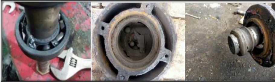
Gambar 7. Bearing mengalami kerusakan

Sebagian besar kegagalan bearing, menurut data kegagalan bearing yang telah dibahas, disebabkan oleh kegagalan pelumasan dan keausan rumah bearing. Jika jadwal pelumasan tidak ada, pelumasan tidak diperhatikan. Oleh karena itu, melakukan pelumasan secara teratur adalah langkah pencegahan dan perawatan untuk mencegah kerusakan berulang.