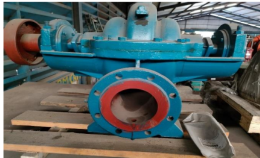
Gambar 1. Pompa Sentrifugal

Metode pengumpulan data yang dipakai dalam penelitian adalah metode observasi, Metode observasi adalah salah satu metode pengumpulan data yang dilakukan melalui pengamatan dan berbagai catatan tentang keadaan atau perilaku objek sasaran. Metode observasi juga dapat didefinisikan sebagai aktivitas terhadap proses atau objek yang dimaksud dengan merasakan dan memahami pengetahuan tentang fenomena. Ini dilakukan untuk meningkatkan pengetahuan dan konsep yang sudah diketahui untuk mendapatkan lebih banyak informasi yang diperlukan untuk penelitian yang lebih lanjut.