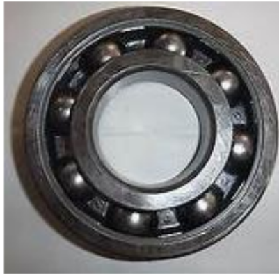
Gambar 3. Bearing 6311

Dalam penelitian ini, kami menggunakan jenis bantalan (bearing) yang biasa digunakan pada pompa sentrifugal between bearing dan biasanya memiliki ukuran utama standar sebagai acuan. Jenis bearing yang digunakan pada pompa sentrifugal between bearing yaitu Single row deep groove ball bearings dengan kode 6311.[9]