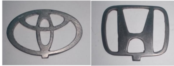
Gambar 4. Hasil Produk Aksesoris Emblem Mobil Toyota dan Honda