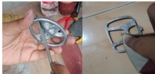
Gambar 3. Proses Perapihan Benda

Sebelum mencetak produk, cetakan dibuat terlebih dahulu dengan bahan tanah liat kemudian menekan pola emblem hingga permukaan tanah liat cekung, selanjutnya cairan aluminium dituang pada cetakan.