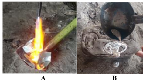
Gambar 2. Proses Pencairan dan Pencetakan Benda