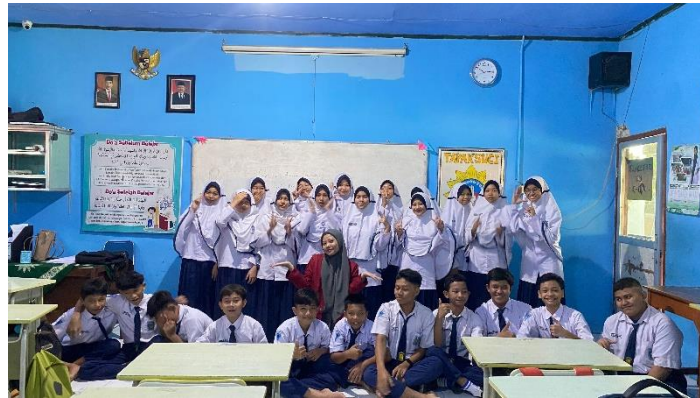
Gambar 1. 3

Berikut akan peneliti uraikan data nilai siswa kelas control dan kelas eksperimen.