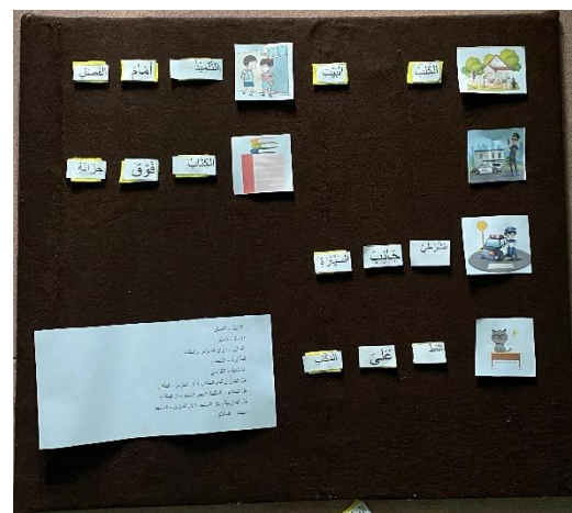
Gambar 1. 2