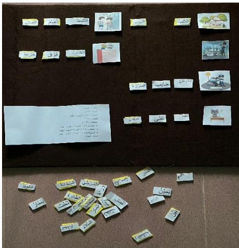
Gambar 1. 1

Peneliti melakukan penelitian tahap pertama pada kelas control yaitu dikelas VII A yang dimana kelas control ini hanya menggunakan metode ceramah, peneliti hanya menyampikan materi bahasa arab bab حرف الجر و ظروف kemudian siswa diberikan lembar kerja postets. Selanjutnya peneliti melakukan penelitian di kelas eksperimen yaitu kelas VII B ( muhammadaiyah Boarding School ). Yang diberikan penerapan media papan flanel setelah melakukan uji pretest. Kemudian peneliti menyampikan materi tentang الحرف الجر و ظروف kemudian memberikan pertanyaan kepada siswa tentang peletakan harokat terhadap kalimat sesudah harfu jar, dan mencontohkan siswa dalam menyusun kalimat yang sempurna/ jumlah mufidah. Kemudian peneliti menjelaskan cara kerja media papan flanel arab tersebut.