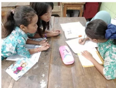
Gambar 3 Komunikasi dan Interaksi antar Budaya

Komunikasi dan interaksi antar budaya merupakan kunci penting dalam membangun hubungan yang harmonis di tengah masyarakat yang multikultural. SDN Tenggulunan telah berhasil menciptakan lingkungan yang mendukung siswa dalam belajar dan berinteraksi dengan teman dari berbagai budaya atau suku yang berbeda. Pendidikan tentang komunikasi antar budaya haruslah ditanamkan sejak dini, agar siswa dapat memahami pentingnya menghargai perbedaan dan bertoleransi terhadap budaya-budaya lain. Dengan demikian, diharapkan generasi muda dapat tumbuh menjadi individu yang menghargai dan menghormati keragaman budaya di masyarakat.