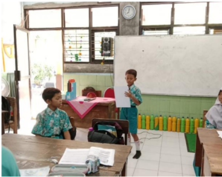
Gambar 2 Mengetahui dan Menghargai Budaya

pendidikan yang efektif dalam mengenalkan budaya dari berbagai negara haruslah menyajikan informasi yang akurat dan menarik bagi siswa. Selain itu, program tersebut juga harus memberikan kesempatan kepada siswa untuk berinteraksi langsung dengan budaya tersebut, misalnya melalui kegiatan menggambar, membuat kerajinan tangan, atau mendengarkan musik tradisional. Dengan demikian, SDN Tenggulunan dapat dijadikan contoh dalam mengembangkan program pendidikan yang mengenalkan budaya dari berbagai negara kepada siswa. Dengan begitu, diharapkan generasi muda dapat tumbuh menjadi individu yang lebih menghargai dan memahami keragaman budaya di dunia.