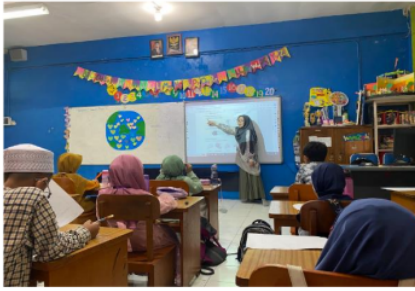
Gambar 2. Ruang kelas 1