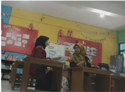
Gambar 4. Wawancara Guru Kelas 1

Temuan kedua dalam penelitian ini berkaitan dengan hasil dari wawancara 2 guru kelas dalam kemampuan literasi digital antara 1 guru laki-laki dan 1 guru perempuan dari beberapa pertanyaan yang telah disediakan kemudian di jawab oleh 2 guru mengenai kemampuan serta pengetahuannya mengenai beberapa aspek literasi digital antara lain pemahaman tentang literasi digital, indikator literasi digital menurut Kominfo, keterampilan dalam penerapan literasi digital kepada peserta didik, hambatan serta solusi yang diterapkan pada saat pembelajaran dengan menerapkan literasi digital. Selanjutnya, guru menjawab pertanyaan wawancara sesuai dengan pemahaman dan menerapkan literasi digital dalam kegiatan pembelajaran sehari-harinya agar peneliti dapat mengetahui kemampuan dari masing-masing 2 subjek penelitian ini 1 guru laki-laki dan 1 guru perempuan. Apakah terdapat perbedaan yang signifikan terhadap pengetahuan dan kemampuan guru berdasarkan gender dalam penerapan literasi digital di SD Muhammadiyah 1 Sidoarjo yang telah menjadi sekolah digital agar tidak ada bias gender dalam kemampuan guru dalam menerapkan literasi digital saat kegiatan pembelajaran dikelas. Wawancara dilakukan pada tempat yang berbeda, wawancara dilakukan pada ruang kelas masing-masing guru. Gambar 4 pada ruang kelas 1 dan Gambar 5 pada ruang kelas 3.