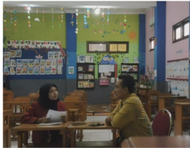
Gambar 5. Wawancara Guru Kelas 3