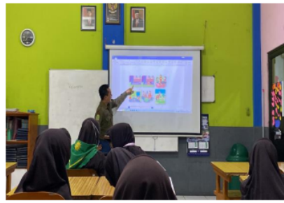
Gambar 3. Ruang kelas 3

Temuan kedua dalam penelitian ini berkaitan dengan hasil dari wawancara 2 guru kelas dalam kemampuan literasi digital antara 1 guru laki-laki dan 1 guru perempuan dari beberapa pertanyaan yang telah disediakan kemudian di jawab oleh 2 guru mengenai kemampuan serta pengetahuannya mengenai beberapa aspek literasi digital antara lain pemahaman tentang literasi digital, indikator literasi digital menurut Kominfo, keterampilan dalam penerapan literasi digital kepada peserta didik, hambatan serta solusi yang diterapkan pada saat pembelajaran dengan menerapkan literasi digital. Selanjutnya, guru menjawab pertanyaan wawancara sesuai dengan pemahaman dan menerapkan literasi digital dalam kegiatan pembelajaran sehari-harinya agar peneliti dapat mengetahui kemampuan dari masing-masing 2 subjek penelitian ini 1 guru laki-laki dan 1 guru perempuan. Apakah terdapat perbedaan yang signifikan terhadap pengetahuan dan kemampuan guru berdasarkan gender dalam penerapan literasi digital di SD Muhammadiyah 1 Sidoarjo yang telah menjadi sekolah digital agar tidak ada bias gender dalam kemampuan guru dalam menerapkan literasi digital saat kegiatan pembelajaran dikelas. Wawancara dilakukan pada tempat yang berbeda, wawancara dilakukan pada ruang kelas masing-masing guru. Gambar 4 pada ruang kelas 1 dan Gambar 5 pada ruang kelas 3.