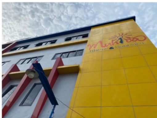
Gambar 1. Terdapat Tulisan Jargon SD Muhammadiyah 1 Sidoarjo “Islamic & Digital School”

Penelitian ini memiliki tujuan agar dapat mengetahui kemampuan literasi digital guru SD Muhammadiyah 1 Sidoarjo yang ditinjau dari perspektif gender antara guru laki-laki dan guru perempuan dalam menerapkan literasi digital dalam pembelajaran di SD Muhammadiyah 1 Sidoarjo. Berdasarkan hasil wawancara, angket oleh 2 guru laki-laki dan perempuan di SD Muhammadiyah 1 Sidoarjo dan dengan disertai dokumentasi dalam penelitian terkait kemampuan literasi guru yang ditinjau oleh perspektif gender di SD Muhammadiyah 1 Sidoarjo. Pertama, sekolah SD Muhammadiyah 1 Sidoarjo ini memang telah menjadikan sekolah yang menerapkan kegiatan pembelajaran berbasis digitalisasi. Pembelajaran dengan menggunakan digitalisasi ini telah diterapkan dalam kegiatan pembelajaran di semua jenjang kelas mulai kelas 1 sampai dengan kelas 6. Sehingga, penelitian ini telah sesuai dengan penelitian literasi digital karena memang sekolah SD Muhammadiyah 1 Sidoarjo telah menjadikan sekolah berbasis digital sesuai dengan jargon sekolah SD Muhammadiyah 1 Sidoarjo yaitu “Islamic And Digital School”. Dalam hal ini, memang tampak dari halaman depan sekolah telah terdapat tulisan yang menunjukkan bahwa memang SD Muhammadiyah 1 Sidoarjo ini menjadikan sekolah dasar ini berbasis sekolah digital atau digital school. Dapat dilihat pada Gambar 1.