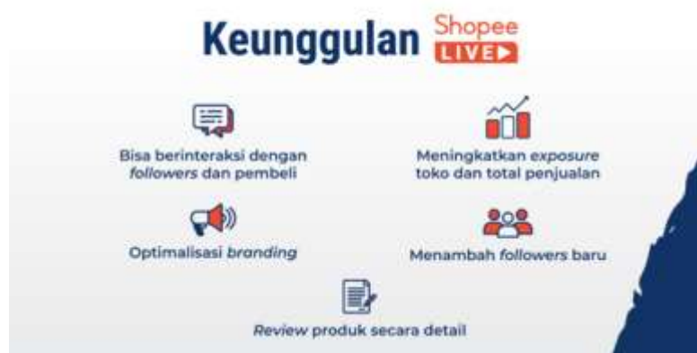
Gambar 1. Keunggulan Shopee Live

fitur Shopee Live. Shopee Live, seperti namanya, adalah cara baru bagi penjual di Shopee untuk terlibat dalam pemasaran langsung yaitu, berjualan sambil melakukan percakapan langsung dengan pelanggan melalui Marketplace Shopee.