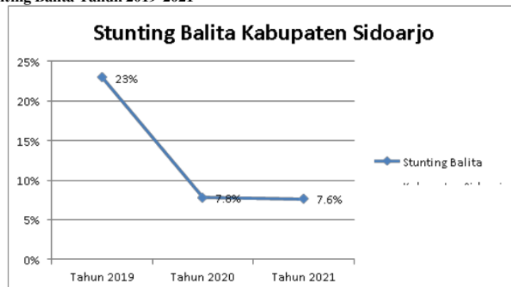
Grafik 1.3 Stunting Balita Tahun 2019-2021

Tingkat pada partisipasi masyarakat dalam melakukan peningkatan gizi balita dapat dilihat dari jumlah balita yang mengikuti timbang dan akan dibagi dengan seberapa jumlah sasaran pada balita. Bahkan dalam Kabupaten Sidoarjo jumlah balita pada tahun 2020 mengalami penurunan, setidaknya dalam Pusdatin Kementrian Kesehatan Republik Indonesia 176.558. Tetapi jumlah pada balita yang datang untuk timbang yakni 64.267 (36,40%).