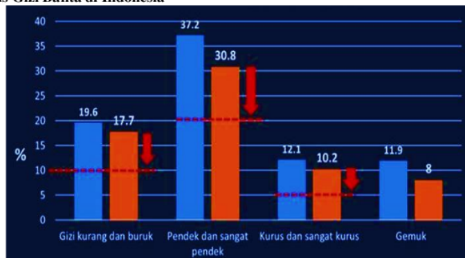
Gambar 1.1 Status Gizi Balita di Indonesia