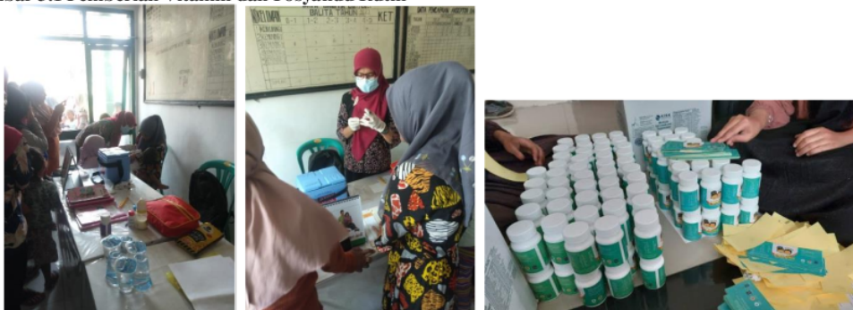
Gambar 3.1 Pemberian Vitamin dan Posyandu Rutin