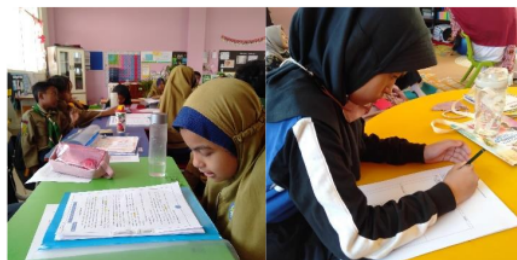
Gambar 2 peserta didik melakukan aktivitas belajar

Mengenai bagaimana pembelajaran literasi dapat membentuk kecerdasan sosial, peneliti menggunakan teori kecerdasan sosial dari Karl Albrecht dengan indikator kesadaran akan situasi, pembawaan diri, keaslian, kejelasan, dan juga empati atau juga sering disebut S.P.A.C.E.